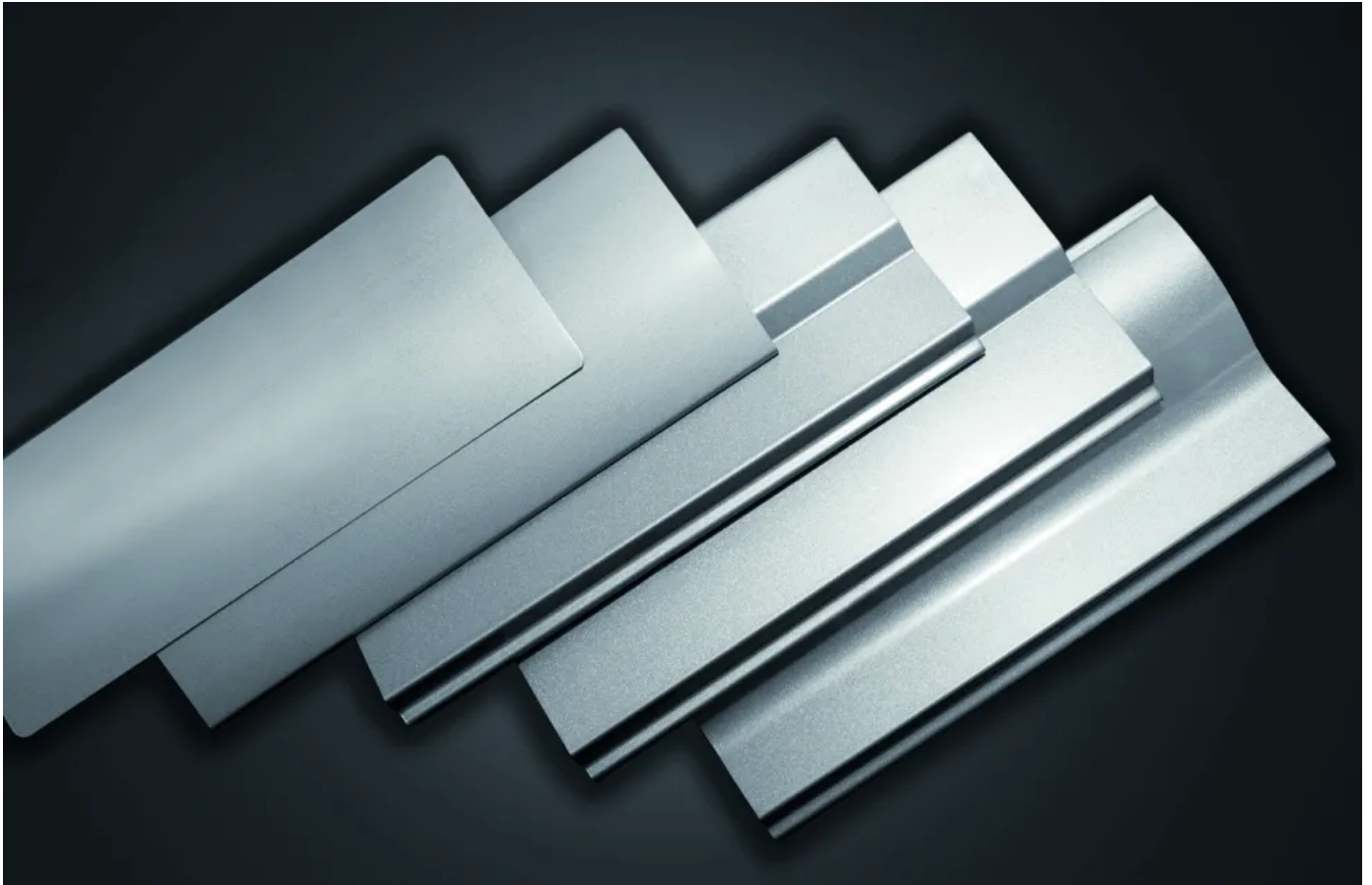
ARtec Raffstore Lamellenformen

Aus der Serie Rollladensysteme | Textilscreens | Raffstoresysteme für Neu- und Altbau von Alulux