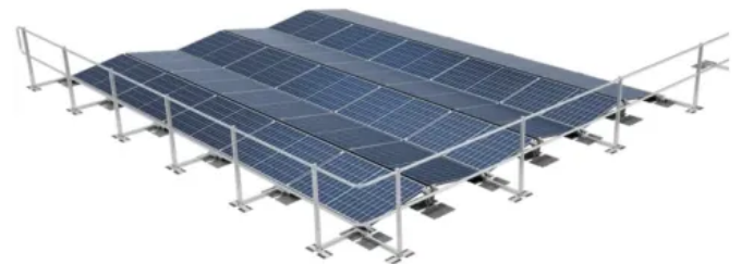
Seitenschutzgeländer ABS Solar Guard für ABS Base PV-Unterkonstruktionen