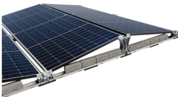
BS Base Weight Unterkonstruktion für PV-Module zur Auflastbeschwerung