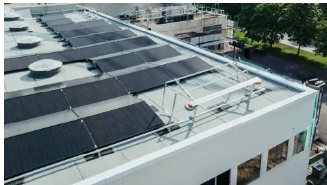
Das einklappbare Geländer erzeugt keinen permanenten Schatten auf den Solar-Modulen, was die Effizienz der Photovoltaikanlage erhöht.