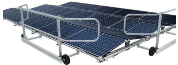
Mobiles Geländersystem ABS Solar Guard Mobile für ABS Base PV-Unterkonstruktionen