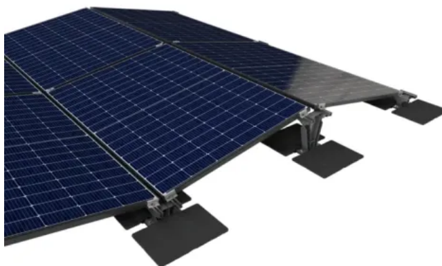
ABS Base Fusion Unterkonstruktion für PV-Module zum Aufschweißen auf Bitumen

Die ABS Base Weight Unterkonstruktion wird mit Ballaststeinen auf dem Flachdach montiert und nimmt neben dem mobilen Geländer auch das überfahrbare ABS Seilsystem auf.