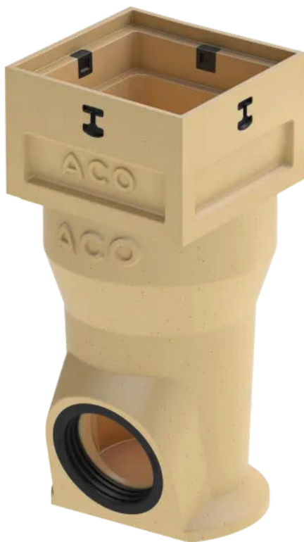
ACO Self® Europoint Langform