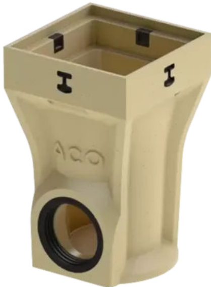
ACO Self® Europoint