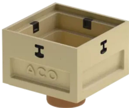
ACO Self® Europoint Kurzform