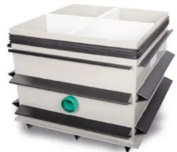
Pumpensumpf aus Kunststoff, eckig