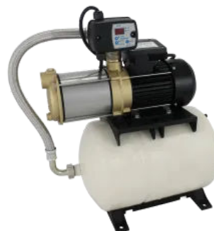
Saniboost MHP 4-40 B