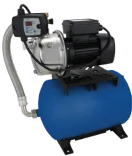
Saniboost SJ 4-50