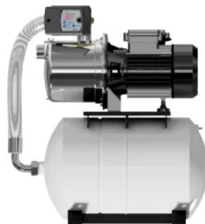
Saniboost SJ 5-55 B