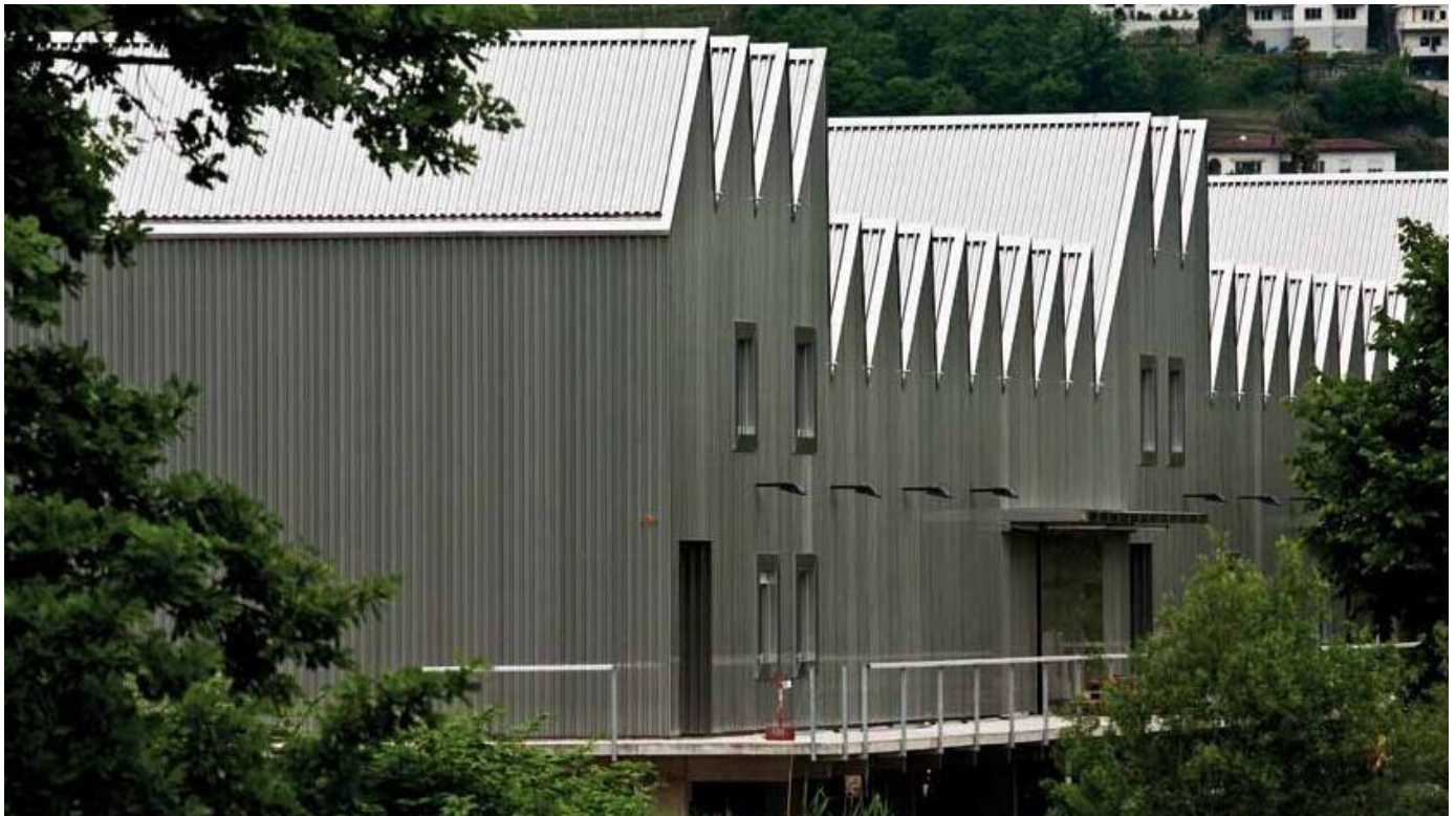
Produkte aus verzinnem Edelstahl für Edelstahldachrinnen und –fallrohre

Aus der Serie Bleche und Bänder aus Edelstahl von Aperam Stainless Services & Solutions Germany