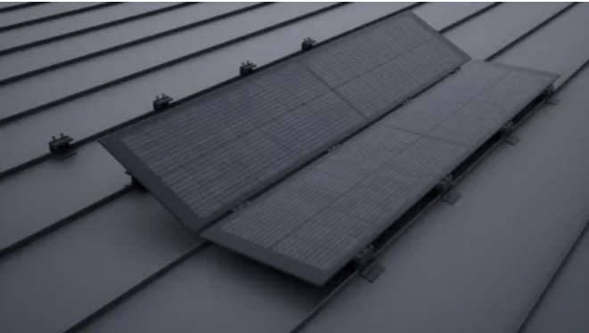
Mit den speziell entwickelten Modulklemmen in Schwarz eloxiert werden die Solarmodule PREFALZ direkt auf den Stehfalzen angebracht. Keine Durchdringung der Dachhaut ist erforderlich.

Aus der Serie PREFA Solarsysteme von PREFA