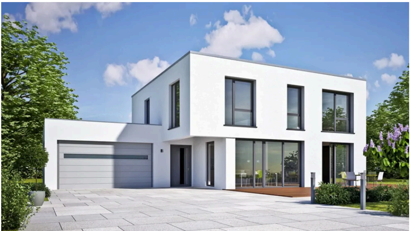
©B.E.G. Brück Electronic GmbH – Highlight your Home through Motion

Liebhaber minimalistischer Architektur wünschen sich stilgerechte Designer-Geräte für die Gebäudefassade oder Eingangsbereiche. Diesem Wunsch kommt B.E.G. mit den neuen Bewegungsmelder-Modellen Aleum nach. Zeitlos klar ist die Formensprache – wie zwei übereinanderstehende Kuben. Gleichzeitig erlaubt die B.E.G.-Technik dem Eigentümer Individualisierungsmöglichkeiten, u. a. durch eine mechanische Reichweitenanpassung. Die Geräte sind in zwei Varianten und auf Wunsch mit Aufputzsockel für aufputzverlegte Leitungen erhältlich.