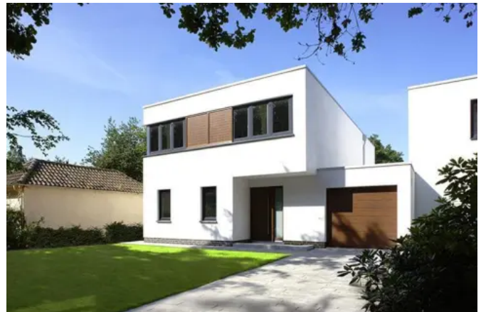
Poroton-Ziegel sind wohngesund, sicher und natürlich.

Poroton-Ziegel bieten die Sicherheit, auch zukünftig hohe technische und ökologische Anforderungen zu erfüllen und kommen ohne weitere Wärmedämmung aus.