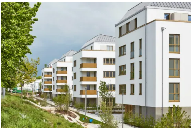
Perlite oder Mineralwolle verfüllte Ziegel erfüllen die Anforderungen an Schallschutz und Energetische Standards im Mehrgeschossbau.