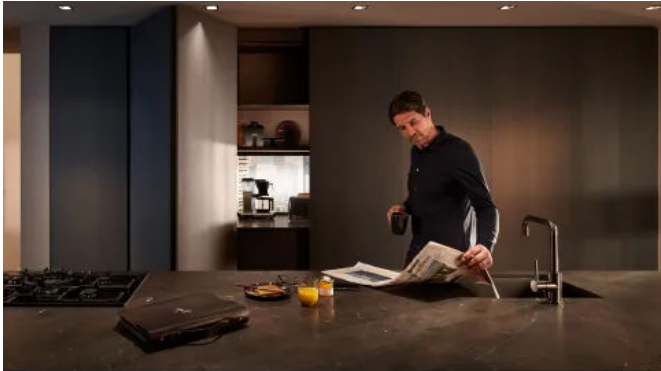
REVEGO duo: Wenn nicht benötigt, werden mit REVEGO Arbeitsbereiche ganz schnell wieder verborgen.