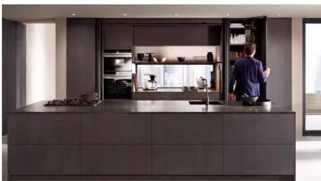
REVEGO öffnet bei Bedarf großzügige Arbeitsflächen in der Küche.