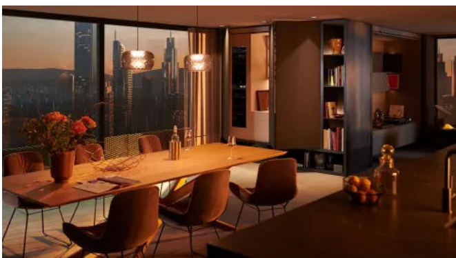
REVEGO als Baranwendung