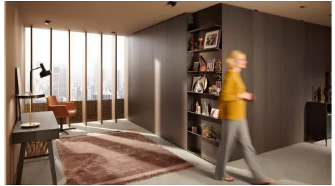
REVEGO geschlossen - Wohnbereich ohne Homeoffice