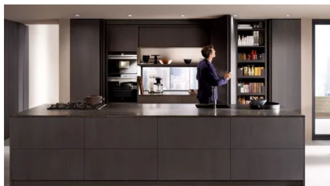
Im geöffneten Zustand ist die Küchenzeile sicht- und nutzbar.

REVEGO, das Einschietbetürsystem für Einzel- und Doppeltüranwendungen bietet eine im Pocket vollständig integrierte Scharnier-Technik und lässt sich bequem ins Küchenlayout oder die Möbelzeile eingliedern.