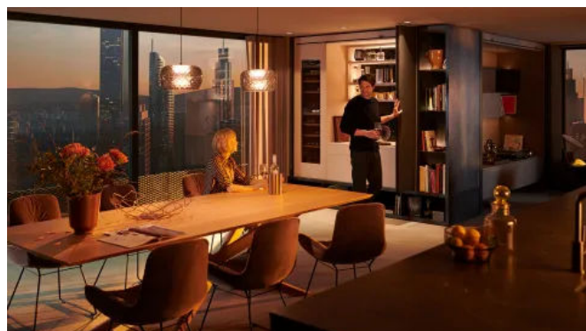
Mit REVEGO ist die Hausbar mit nur einem Handgriff geöffnet.