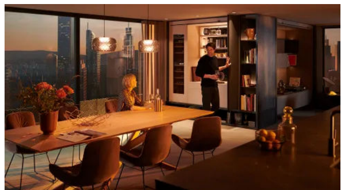
Mit REVEGO ist die Hausbar mit nur einem Handgriff geöffnet.