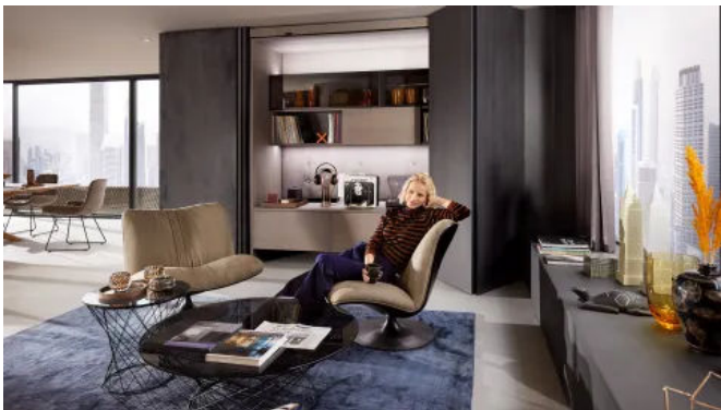
REVEGO im Wohnzimmer