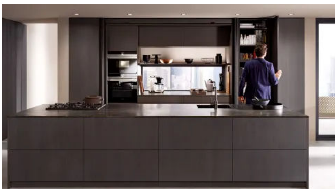
REVEGO öffnet bei Bedarf großzügige Arbeitsflächen in der Küche.