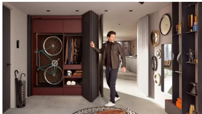
REVEGO Lösung in der Diele