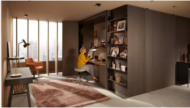
REVEGO geöffnet - Homeoffice im Wohnbereich