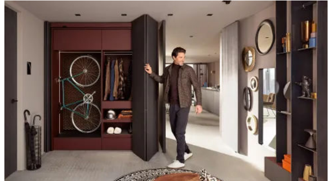
REVEGO Lösung in der Diele