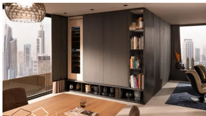
REVEGO bietet auch für den Wohnbereich Impulse.