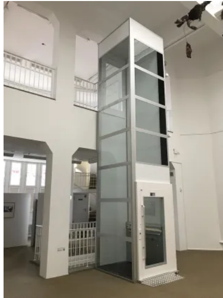
HIRO Lift A4