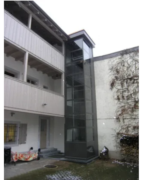
HIRO Lift A4

Der HIRO A4 ist ein Plattform-Senkrechtlift, der sich ideal für private und gewerbliche Gebäude eignet. Er überzeugt durch sein kompaktes Design, eine niedrige Schachtgrube von nur 6 cm und eine einfache, schnelle Installation auch in Bestandsgebäuden.