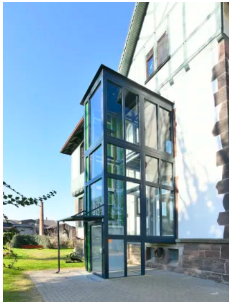
HIRO Lift 420