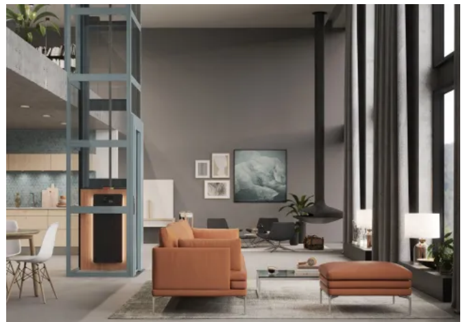
HIRO A4 Air