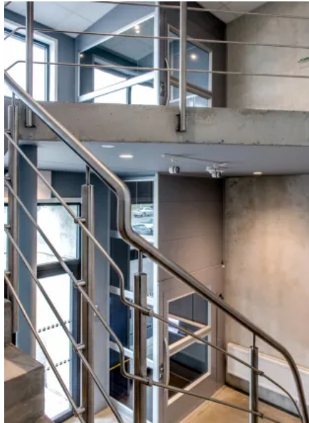
HIRO A4 Mille