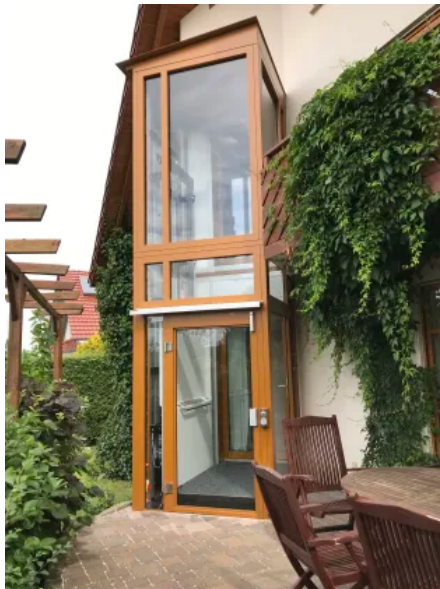
HIRO Lift 420