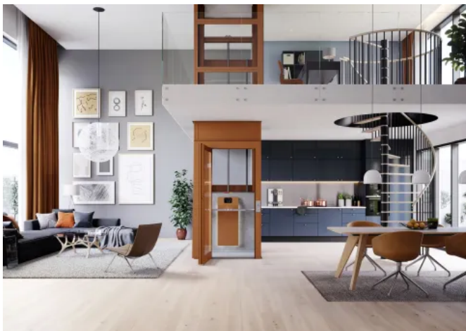
HIRO A4 Air