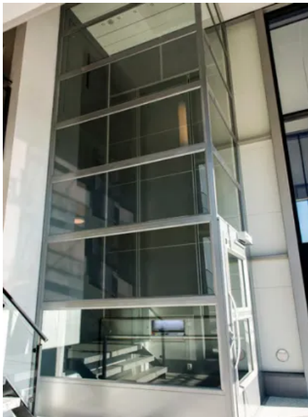
HIRO A4 Mille