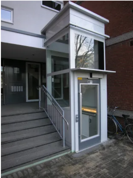
HIRO Lift A4