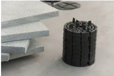
Je nachdem, welche Höhendifferenz überbrückt werden muss, bietet PLATTENFIX das geeignete Platten- oder Stelzlager.

Aus der Serie Plattenlager und Fugenkreuze von PLATTENFIX