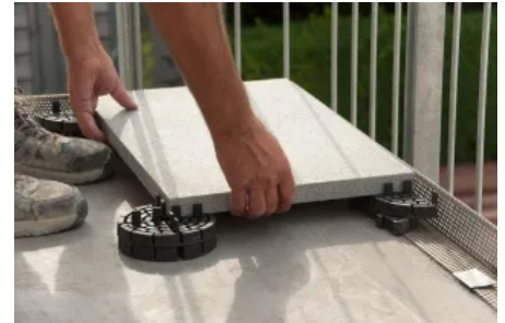
Die zu verlegenden Platten liegen immer mit einer Ecke auf einem Viertelstück eines PLATTENFIX Plattenlagers auf.