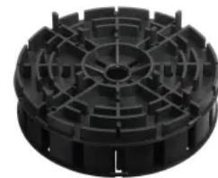
MULTI und MULTI+PLUS sind miteinander kombinier- und bis zu siebenfach stapelbar

MULTI und MULTI+PLUS sind bis zu siebenfach stapelbar und können Höhenunterschiede bis zu 24,5 cm ausgleichen. Damit sind sie optimal für weitläufige und ebene Flächen einsetzbar. Mit ihrer großen Auflagefläche und hohen Belastbarkeit sind die MULTI-Lager auch für Keramikplatten geeignet. In Kombination mit den VARIO-Lagern lassen sich um Höhenunterschiede noch feiner zu nivellieren.