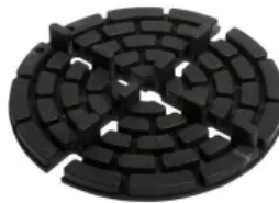
MAXI (teil-/stapelbar), Ø 150 mm, h 10 mm, hier mit Fugensteg: 6x10 mm