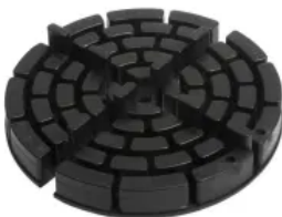
MAXI (teil-/stapelbar), Ø 150 mm, h 20 mm, hier mit Fugensteg: 6x10 mm