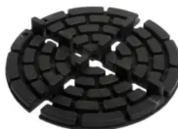
MAXI (teil-/stapelbar), Ø 150 mm, h 10 mm, hier mit Fugensteg: 6x10 mm