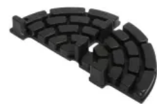
MAXI-Randstück (teil-/stapelbar), Ø 150 mm, h 10 mm, hier mit Fugensteg: 6x10 mm

Die MAXI-Plattenlager sind zusätzlich stapelbar, um Höhenunterschiede des Untergrunds auszugleichen. Beim Stapeln ist zu berücksichtigen, dass die Fugenbreite bei allen Lagern identisch ist. Bis zu sechs gestapelte MAXI ermöglichen 12 cm Höhendifferenz. Für feinere Unebenheiten lassen sich in Kombination mit MAXI-Ausgleichsscheiben drei weitere Millimeter ausgleichen.