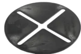
Standard-Ausgleichsscheibe, h 2,6 mm

STANDARD-Plattenlager haben eine Auflagenhöhe von 10 mm und sind in den Fugenbreiten 4 und 6 mm erhältlich. Sie sind mit einem Fugensteg von 10 oder 20 mm Höhe oder ohne Fugensteg lieferbar. Alle STANDARD-Plattenlager sind in 2 Hälften oder 4 Ecken teilbar, aber auch als Randstücke erhältlich. Zum Ausgleich kleiner Unebenheiten gibt es die STANDARD-Ausgleichsscheibe in 2,6 mm.