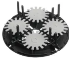
VARIO MINI (teilbar), Ø 180 mm, 20-30 mm stufenlos höhenverstellbar, Fugenstab 55x4 mm