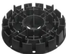
MULTI (teil- und stapelbar), Ø 180 mm, h 35 mm, unten gerippt, Fugensteg 4x15 mm