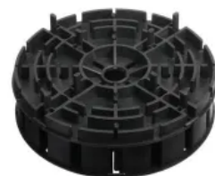
MULTI und MULTI-PLUS sind miteinander kombinier- und bis zu siebenfach stapelbar

MULTI und MULTI-PLUS sind bis zu siebenfach stapelbar und können Höhenunterschiede bis zu 24,5 cm ausgleichen. Damit sind sie optimal für weitläufige und ebene Flächen einsetzbar. Mit ihrer großen Auflagefläche und hohen Belastbarkeit sind die MULTI-Lager auch für Keramikplatten geeignet. In Kombination mit den VARIO-Lagern lassen sich um Höhenunterschiede noch feiner zu nivellieren.