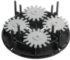
VARIO (teilbar), Ø 180 mm, 35-50 mm stufenlos höhenverstellbar, Fugenstab 65x4 mm