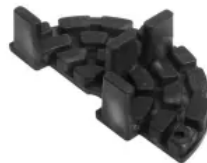
STANDARD-Randstück (teilbar), Ø 120 mm, h 10 mm, hier mit Fugensteg 6x20 mm