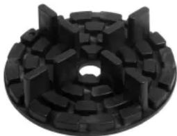
STANDARD (teilbar), Ø 120 mm, h 10 mm, hier mit Fugensteg 6x20 mm