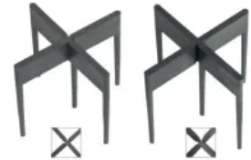
Fugenkreuz mit Rückdrehsicherung

Mit vier Zahnrädern ist eine stufenlose Höhenregulierung – sogar nachträglich – möglich. Dank der vergrößerten Auflagefläche sind die VARIO-Lager extrem tragfähig und auch für große Platten geeignet. Die VARIO-Lager können in zwei Rand- oder in vier vollwertige Eckstücke geteilt werden und lassen sich mit den MULTI-Lagern kombinieren.