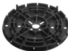
MULTI (teil- und stapelbar), Ø 180 mm, h 15 mm, unten gerippt, Fugensteg 4x15 mm