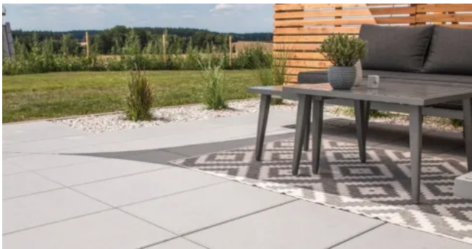
QUARZORO Betonsteinplatte platingrau