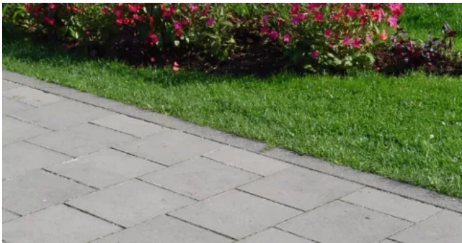
MÜNCHNER GEHWEGPLATTE naturgrau