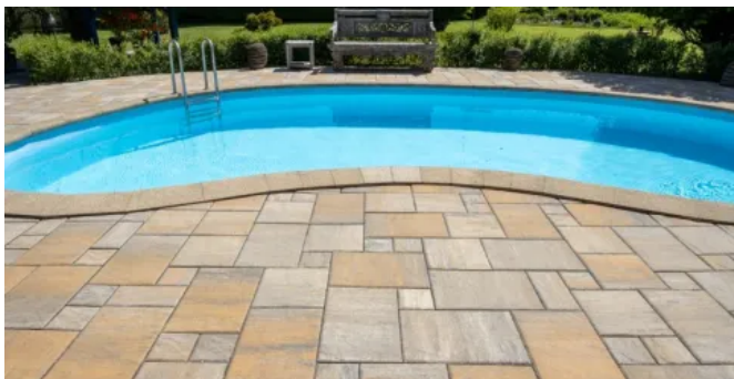
HACIENDA®-ENTRADA Betonsteinplatte terra-grau-beige