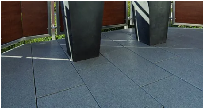
RIVERO Betonsteinplatte platin