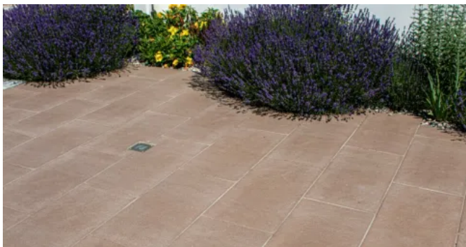
ROCARO SCHIEFER Betonsteinplatte sand