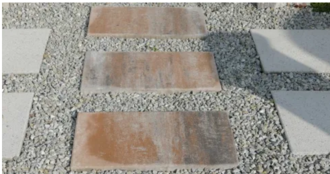
TERRASSENPLATTE marmoriert und naturgrau

Betonsteinplatte in hochwertigen Natursteinkörnungen und mit Microfase Naturmaterialien wie Quarz, Marmor und Basalt verleihen diesen Terrassenplatten ihren Charakter. Die Microfase sorgt als Verschiebesicherung für eine hohe Verlegesicherheit und ein dauerhaftes Fugenbild.