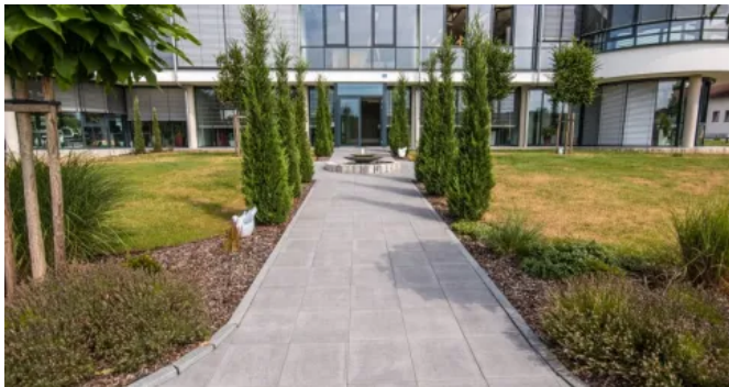
ROCARO Betonsteinplatte platingrau