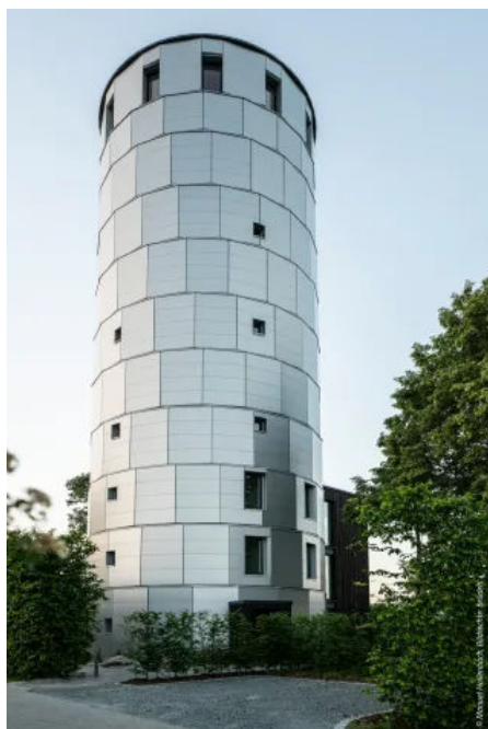
Wasserturm von Pirach