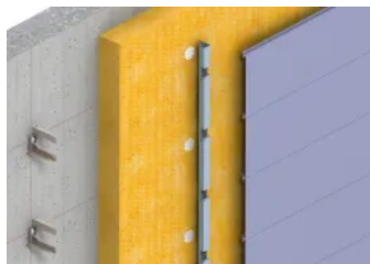
Hinterlüftete Fassade – waagrecht auf Betonwand mit Dämmung