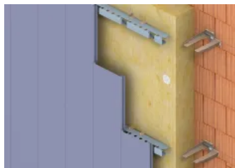
Hinterlüftete Fassade – senkrecht auf Mauerwerk mit Dämmung