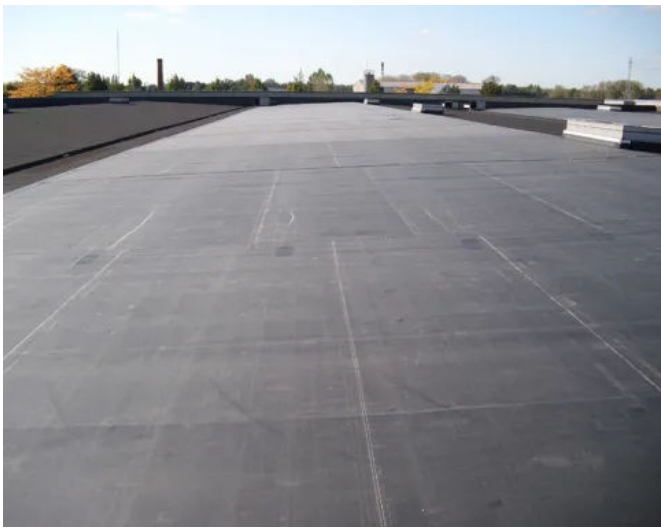
Meubelen Verberckmoes, Sint-Niklaas, Belgien | RubberGard EPDM + ISOGARD HD