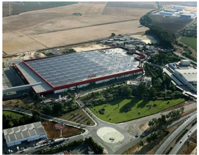
Coca-Cola, Sevilla, Spanien | RubberGard EPDM + ISOGARD HD