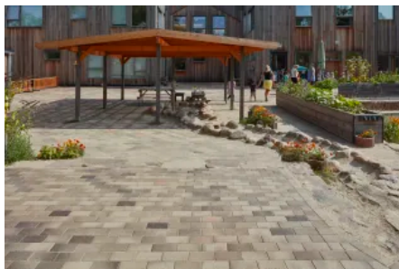
Penter Stralsund Strangpress-Pflasterklinker