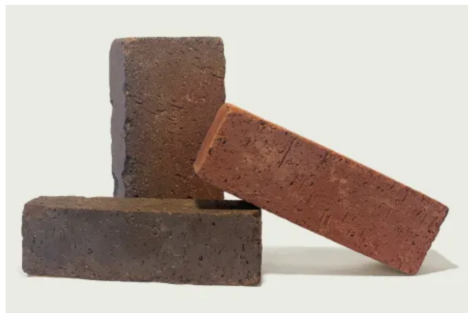
Retro-Pflasterklinker werden nach dem Brennen getrommelt – auch „gerumpelt“ genannt – und erhalten so ihre Retro-Optik.