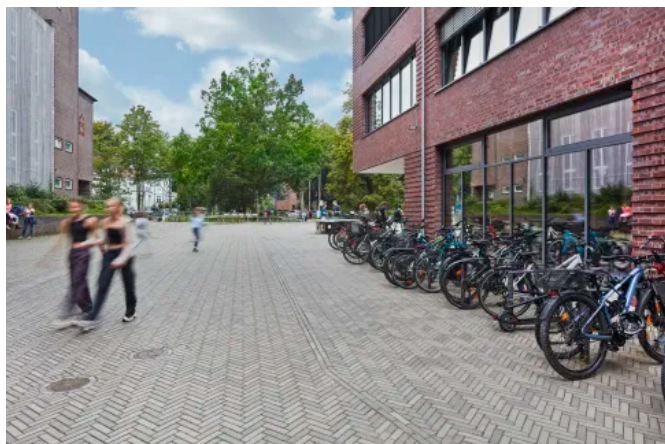
Penter Lotis getrommelt Retro-Pflasterklinker

Einzigartig durch getrommelte Oberfläche