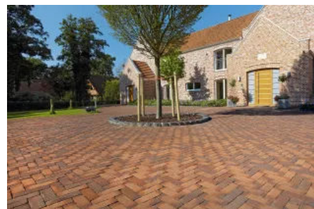
Penter Baltrum Handstrich-Pflasterziegel