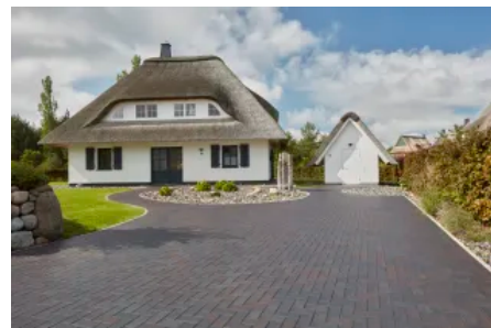
Penter Potsdam Strangpress-Pflasterklinker