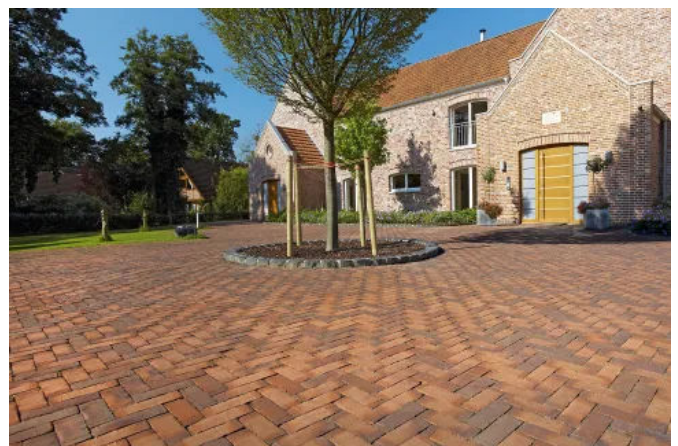
Penter Baltrum Wasserstrich Pflasterziegel

Pflasterklinker sind optimal geeignet für befahrbare und begehbare Pflasterflächen im privaten wie im öffentlichen Bereich.