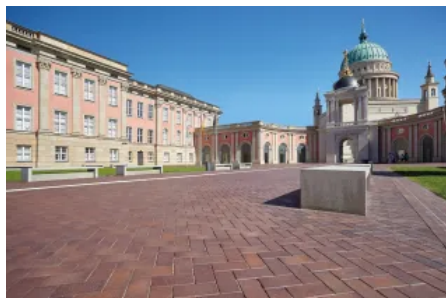
Penter Potsdam Strangpress Pflasterklinker

Charakteristisch für Penter Plaster und Pflasterziegel sind ihre natürlichen Farben und Oberflächenstrukturen, die durch die drei verschiedenen Produktionsverfahren - Strangpress-, Handstrich und getrommelt - entstehen.