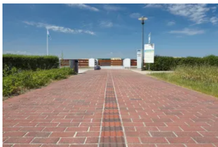
Penter Rotlaubunt extra rau Strangpress-Pflasterklinker