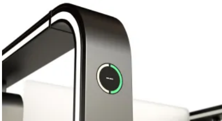
LED-Symbol zeigt den Durchgangstatus der Sensorschleuse an.

Das Expression Speedgate ist für hohen Benutzerkomfort konzipiert. Der große Durchgangsbereich und die intuitive Bedienung sorgen für ein angenehmes Nutzungserlebnis. Optional ausstatten lassen sie sich mit einer Kartenleser-Abdeckung oder einer Gesichtserkennung.