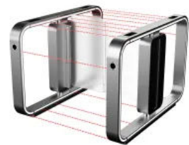
Sicherheits- und Überwachungssensoren gegen Übersteig- und Nachlaufversuche, sowie Unfallschutz.