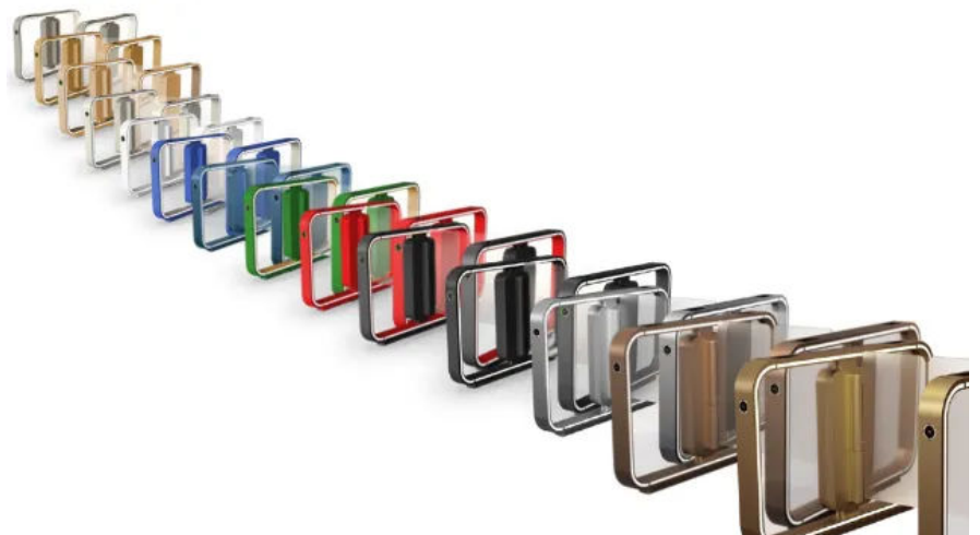
ASSA ABLOY Farben, Oberfläche pulverbeschichtet

Mit einer breiten Palette an Farben lässt sich das ASSA ABLOY Speedgate in jede Architektur gestalterisch einbinden.