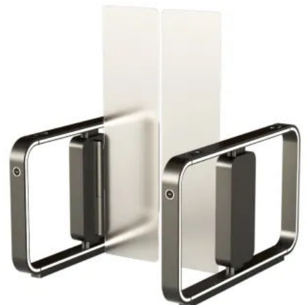
Gehäuselänge 1700 mm | Durchgangsbreite 1100 mm | Sperrhöhe 1800 mm