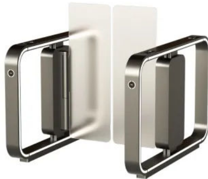
Gehäuselänge 1450 mm | Durchgangsbreite 900 mm | Sperrhöhe 1200 mm