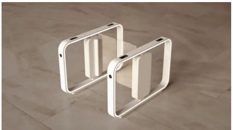
ASSA ABLOY SG Expression Speedgate

Speedgates verwalten und überwachen automatisch den Verkehrsfluss von Fußgängern in stark frequentierten Bereichen. Sie öffnen und schließen sich schnell bei gültiger Autorisierung, um sicherzustellen, dass nur berechtigte Personen Zutritt erhalten und lassen sich mit Technologien wie RFID-Karten, Fingerabdruckscannern oder Gesichtserkennungssystemen verbinden. Das Design des ASSA ABLOY SG Expression bietet ein einheitliches Erscheinungsbild, womit sich der Markenauftritt sowie die Architektur eines Unternehmens ergänzen lässt.