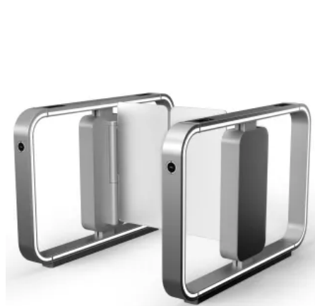
Gehäuselänge 1200 mm | Durchgangsbreite 600 mm | Sperrhöhe 1000 mm

Aus der Serie Personenvereinzelungsanlagen von Record | Part of ASSA ABLOY