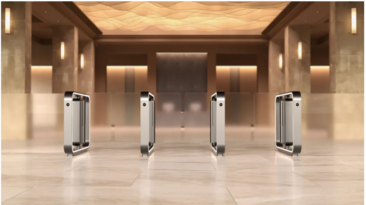
ASSA ABLOY SG Expression in weißaluminium