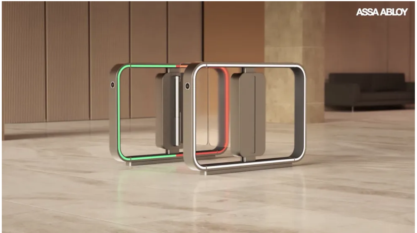
ASSA ABLOY SG Expression Speedgate

Aus der Serie Personenvereinzelnungsanlagen von Record | Part of ASSA ABLOY