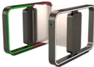
LED-Lichtbänder speziell für Benutzerführung