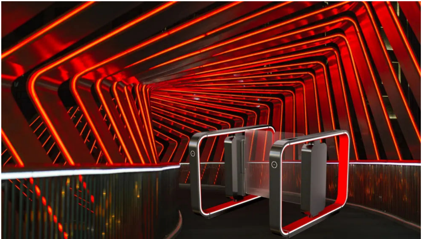
ASSA ABLOY SG Expression in Schwarz und Rot

Aus der Serie Personenvereinzelungsanlagen von Record | Part of ASSA ABLOY