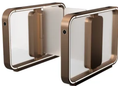
Gehäuse mit Glasfüllung