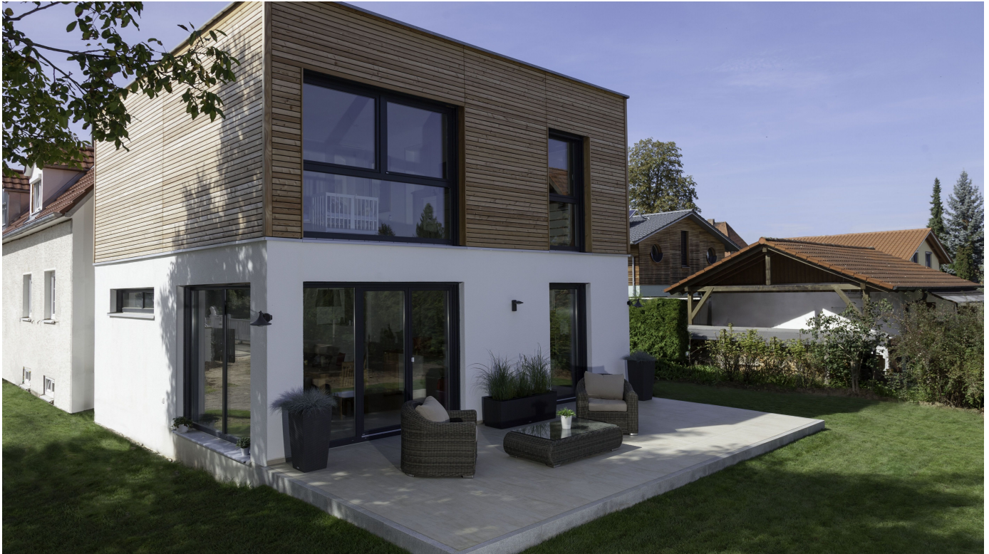
Verlegesysteme für Fliesen- und Naturwerksteinbeläge im Außenbereich

Aus der Serie PCI-Fliesenkleber und -Fugenmörtel für alle Keramik- und Naturwerksteinbeläge von PCI Augsburg