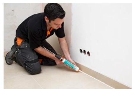
PCI Silcoform® S härtet geruchsneutral aus.

Silikon-Dichtstoff universell innen und außen einsetzbar