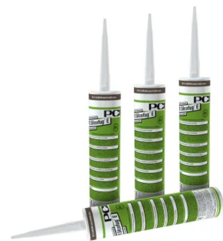
PCI Silcofug® E – elastischer Dichtstoff für innen und außen

PCI bietet passend zu den unterschiedlichen Fugenmörtel-Systemen und zu unterschiedlichen Belagsarten optisch und technisch passend verschiedene Silikon-Fugendichtstoff – Systeme an: