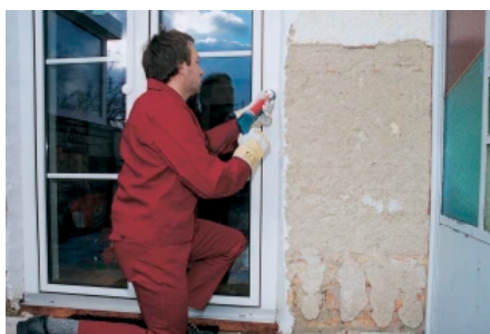
Putzrisse können mit PCI Adaptol plasto-elastisch geschlossen werden.

Acryl-Dichtstoff für Anschlussfugen und Putzrisse