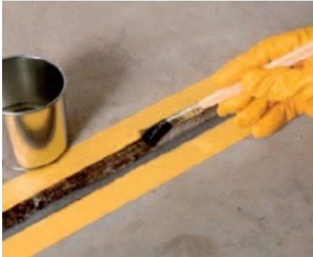
PCI Elastoprimer verbessert die Haftung von PCI-Fugendichtstoffen auf den angegebenen Untergründen

Haft-Grundierung zur Untergrundvorbereitung bei Fugenabdichtungen