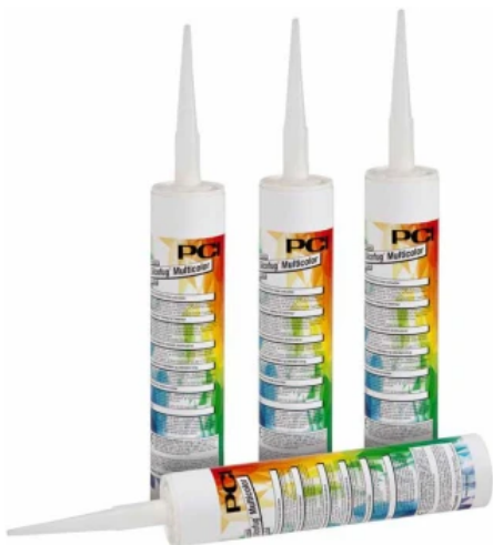
PCI Silcofug® Multicolor – elastischer Dichtstoff für innen und außen

PCI bietet passend zu den unterschiedlichen Fugenmörtel-Systemen und zu unterschiedlichen Belagsarten optisch und technisch passend verschiedene Silikon-Fugendichtstoff – Systeme an: