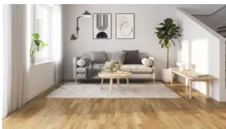
Pure Holzboden Kollektion (13 & 14 mm)

Die Pure Holzboden Kollektion (13 & 14 mm), ist in Qualität, Tradition und Beständigkeit verwurzelt. Die naturbelassenen Holzarten Esche, Birke, Buche und Eiche sorgen für ein natürliches Ambiente. Jede einzelne Diele besitzt ihren ganz eigenen und von Mutter Natur gegebenen Charm und Charakter.