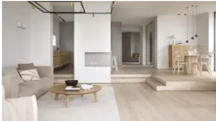
Prestige (14 mm)

Aus der Serie Parkett von Tarkett Holding