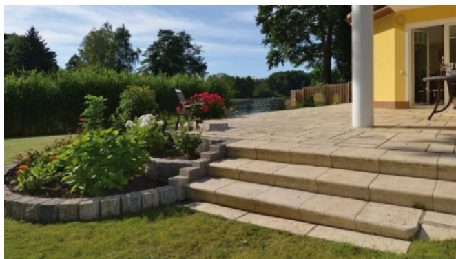
Travino-Stufen in sandstein