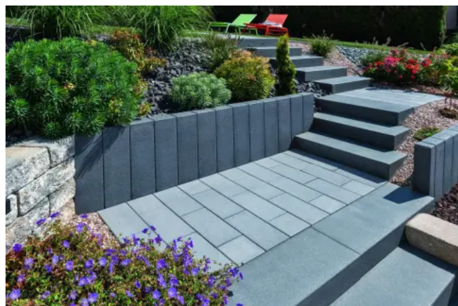
Vios-Palisaden und –Stufen in anthrazit, Vios RX40-Pflaster, grau

Systemelemente: Pflaster, Terrassenplatten, Mauer, Poller, Sitzblöcke