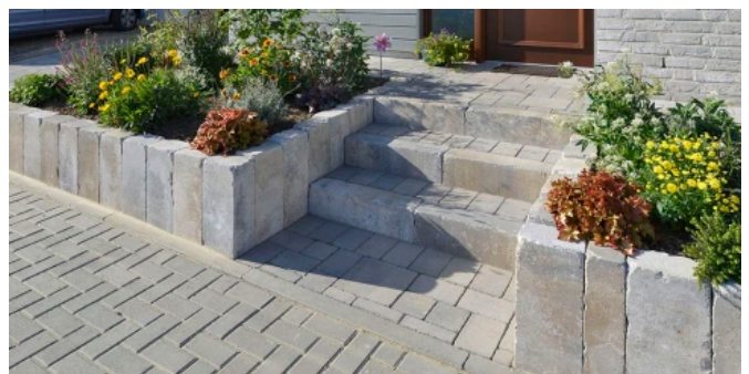
Germania antik®-Palisaden in muschelkalk-nuanciert