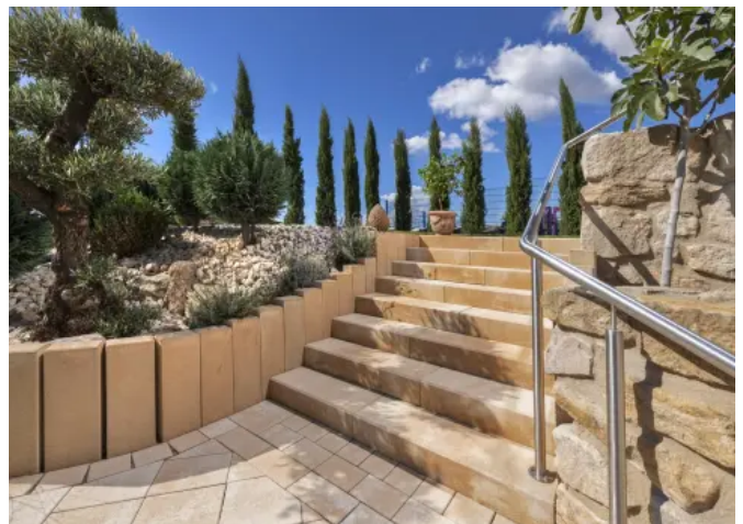
La Tierra® im wilden Verband mit La Tierra-Stufen und La Tierra-Palisaden in der Farbe Sunset

Mehr dazu: La Tierra®-Blockstufen ; La Tierra®-Palisaden