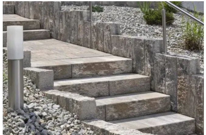
Germania linear im wilden Verband mit Via Leano®-Palisaden und Via Leano®-Stufen in muschelkalk-nuanciert

Mehr dazu: Via Leano®-Blockstufen ; Via Leano®-Palisaden