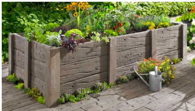
LogBorder-Pfostensystem in Antik-braun