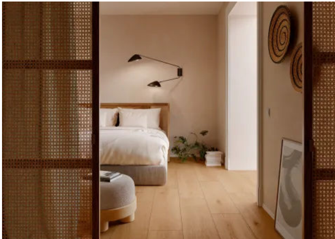
Oltre Caramel Rett. 30x120