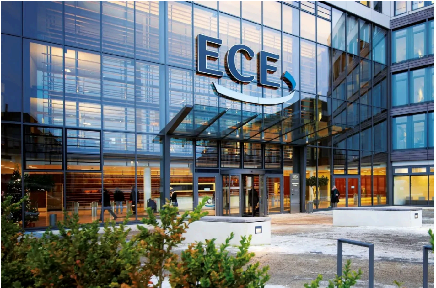
Forster Fuego light T90 / EI 90