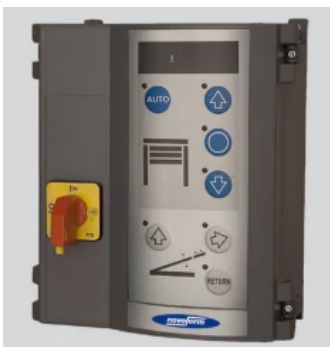
Novo i-Vision TAD (Option)