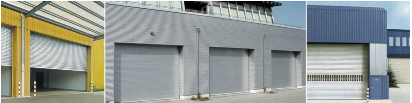
Einbaubeispiele Rolltore TH80 | TH100