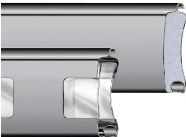
TH80 (oben) und THGL80 (verglast)