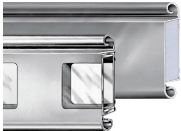
TH100 (oben) und THGL100 (verglast)

80 mm-Alu-Lamellen, doppelwandig, ca. 20 mm dick. Mit wärmedämmendem Polyurethan-Hartschaumkern in klebstofflosem Verbund mit der Schale, daher hohe Flächenstabilität. Speziell entwickelte Profilform ermöglicht engere Wicklung und somit geringere Sturzhöhe.