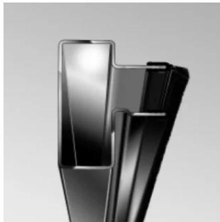
Seitendichtung für Führungsschiene FS2

Für alle Rolltore: Führungsschiene aus Stahl, sendzimirverzinkt, mit aufgesteckten Kunststoffleisten, auch mit Seitendichtung, Montage auch ohne Schweißen mit Stahlhalter möglich.