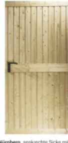
Nürnberg, senkrechte Sicke mit aufgesetzten waagerechten Profilleisten