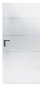
Siegen, waagerechte Lamelle