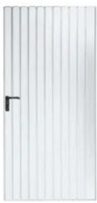
Rees, senkrechte Sicke