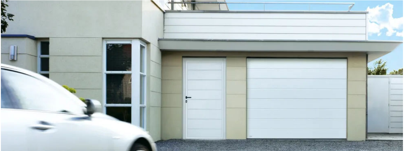
Sektionaltor-Nebentür | Passend und ansichtsgleich zum Garagen-Sektionaltor