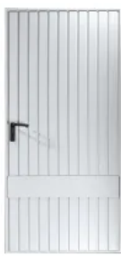
Kassel, senkrechte Sicke mit waagrechtem Mittelprofil