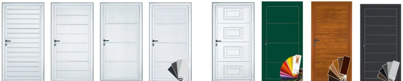
1. Waagerechte Sicke Verkehrsweiß, ähnlich RAL 9016