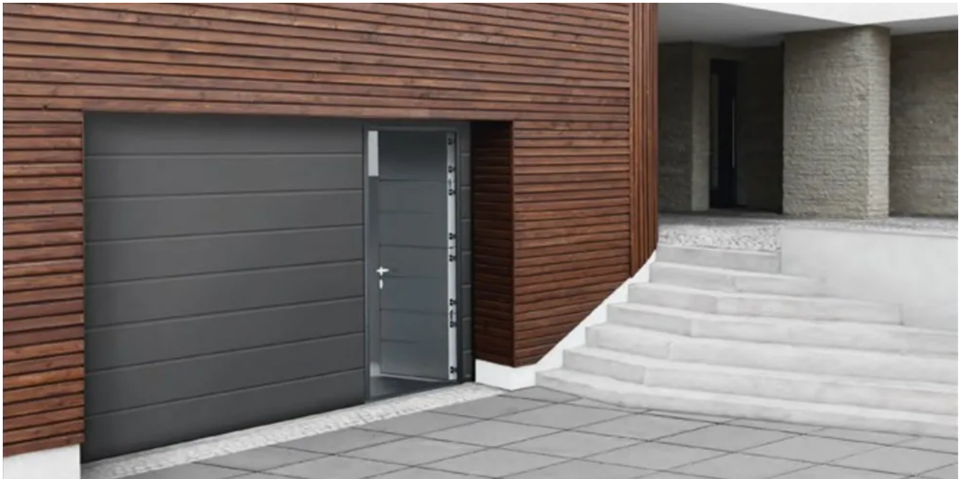
Sektionaltor-Schlupftür | Passend und ansichtsgleich zum Garagen-Sektionaltor

Aus der Serie Garagentorsysteme von Novoferm