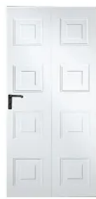
Frankfurt, quadratische Kasette