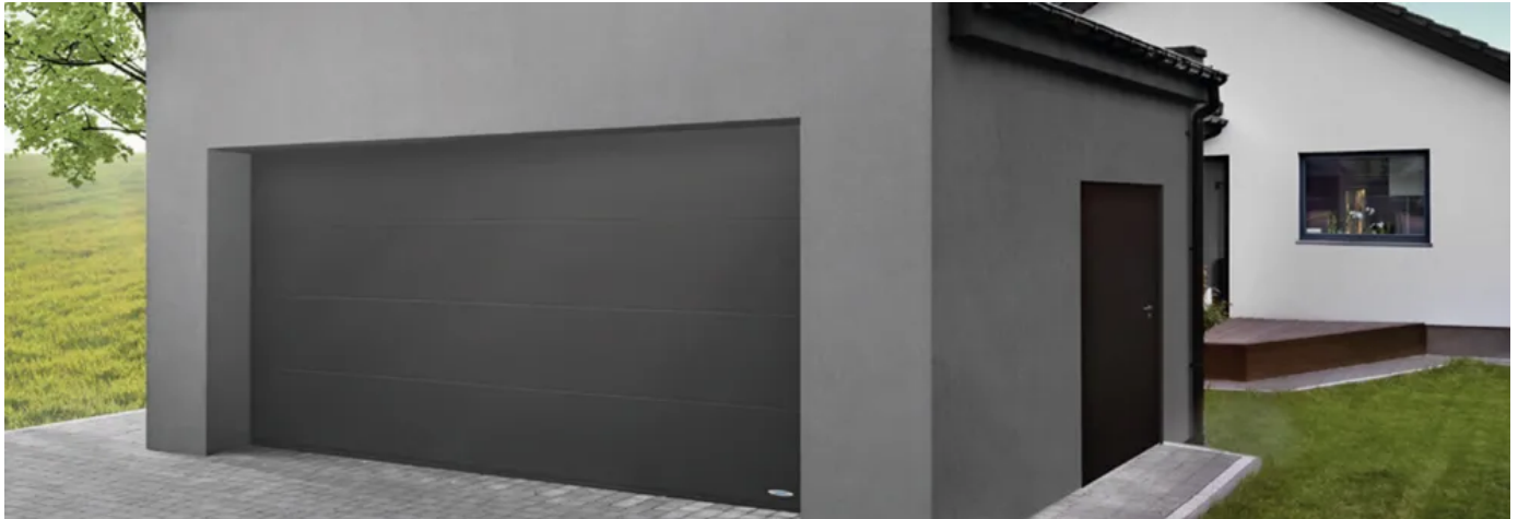
Stahl-Mehrzwecktüren MZ Universal | Für den individuellen Einsatz als Garagen-Neben-, Kelleraußen oder -innentür

Aus der Serie Garagentorsysteme von Novoferm