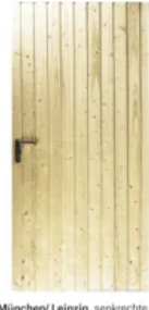
München/Leipzig, senkrechte Sicke