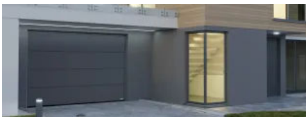
NovoPort® Speed | ein ganzes System für Sektionaltore