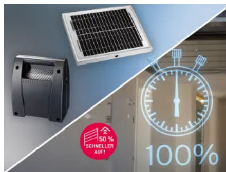
Vielfältige Funktionen | Für unterschiedliche Einsatzzwecke