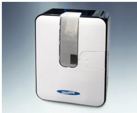
Rolllor-Antrieb | Standardmäßig mit Rohrmotor und 2-Kanal-Handsendern