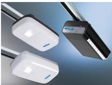
Novomatic Antriebe | Für Neubau und Renovierung