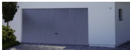
Novomatic | für Sektionaltor- und Schwingtore