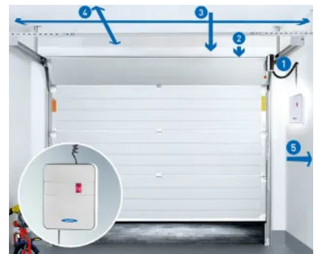
Innovative Seitenmontage | LED-Beleuchtung am Gehäuse für indirekte Garagen-Ausleuchtung.