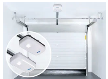
Deckenmontage | Für Sektional- und Schwingtore