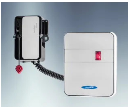
SmartHome-kompatibel | Ein Sektionaltor lässt sich per SmartPhone steuern.