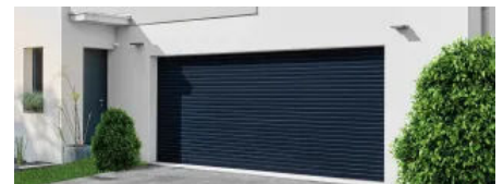
Steuerung für Rolltore | für Rolltore