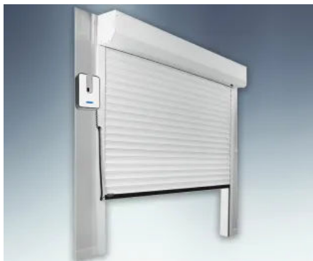
Rolllkasten | Je nach Platzverhältnis Montage vor, in oder hinter der Öffnung