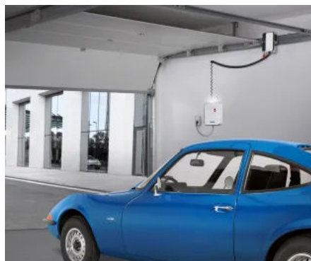
Integrierter Drucktaster | Einfacheres Öffnen und Schließen des Tors.