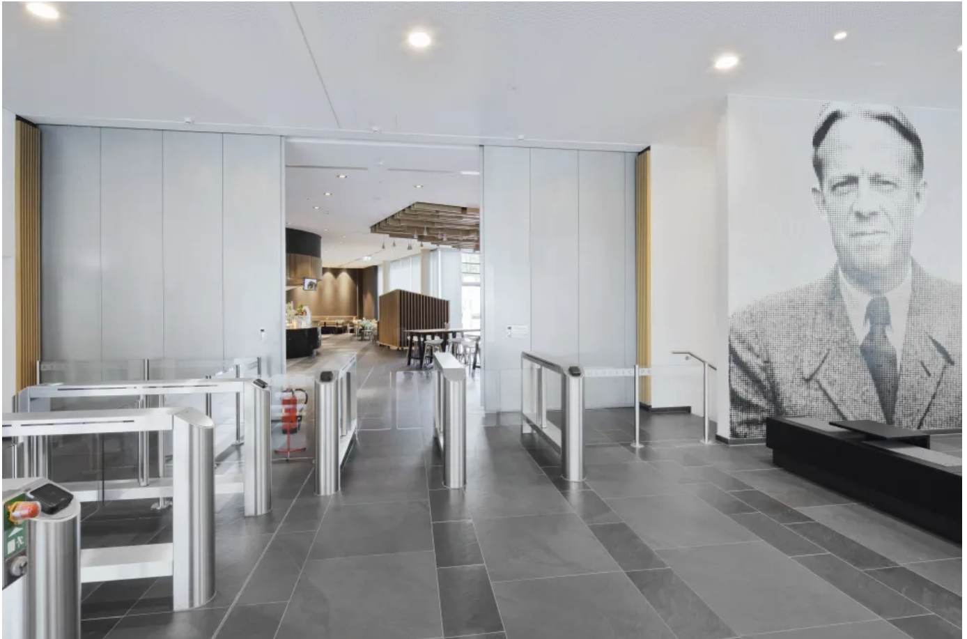
Novoform Feuerschutz-Schiebetore NovoSlide Industry