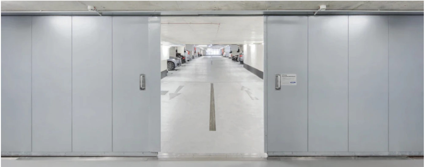
Novoferm Feuerschutz-Schiebetore NovoSlide Industry für Feuerschutzabschlüsse, 2-flügelig