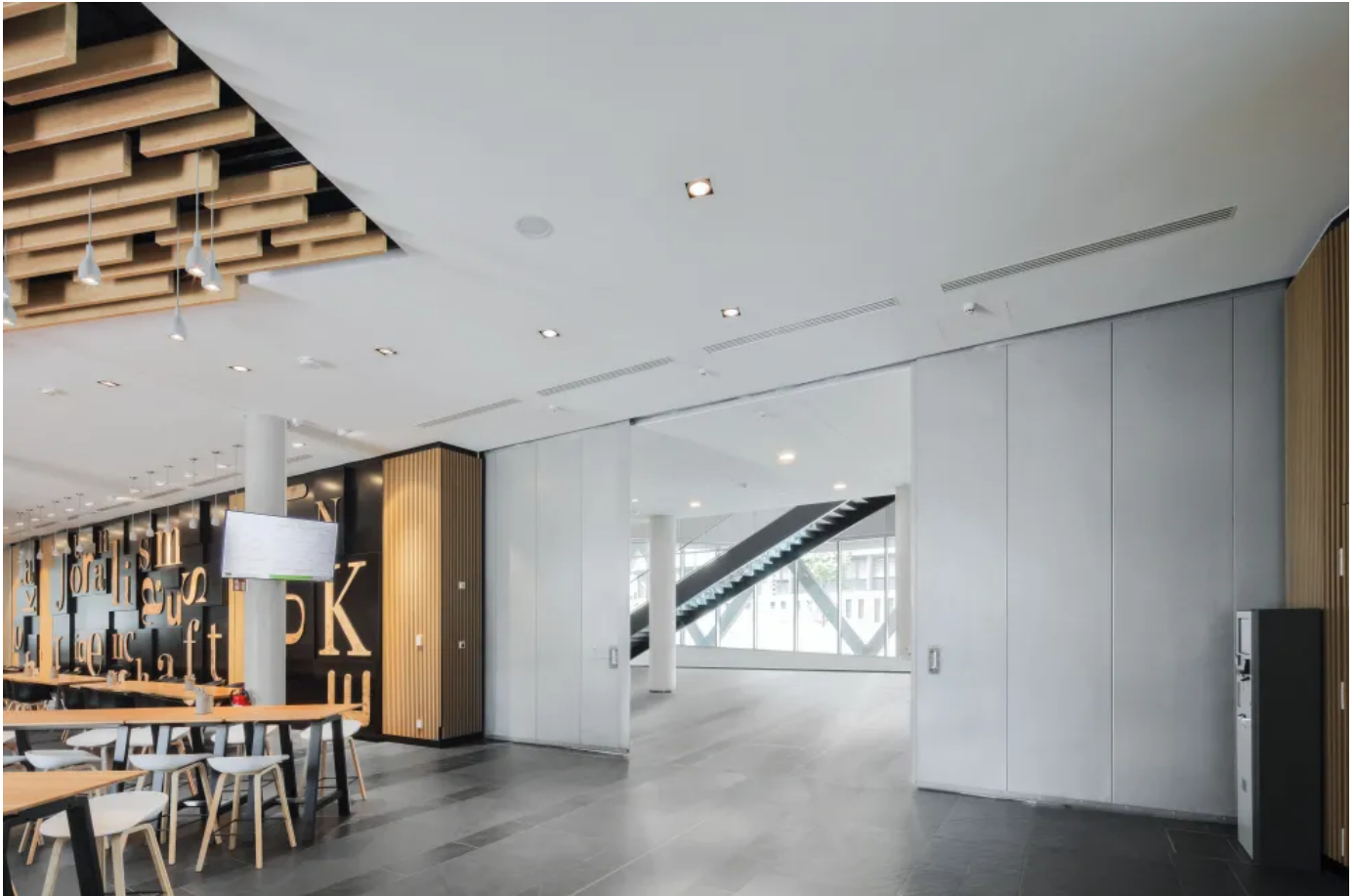
Novoferm Feuerschutz-Schiebetore NovoSlide Industry

Aus der Serie Industrietorsysteme von Novoferm