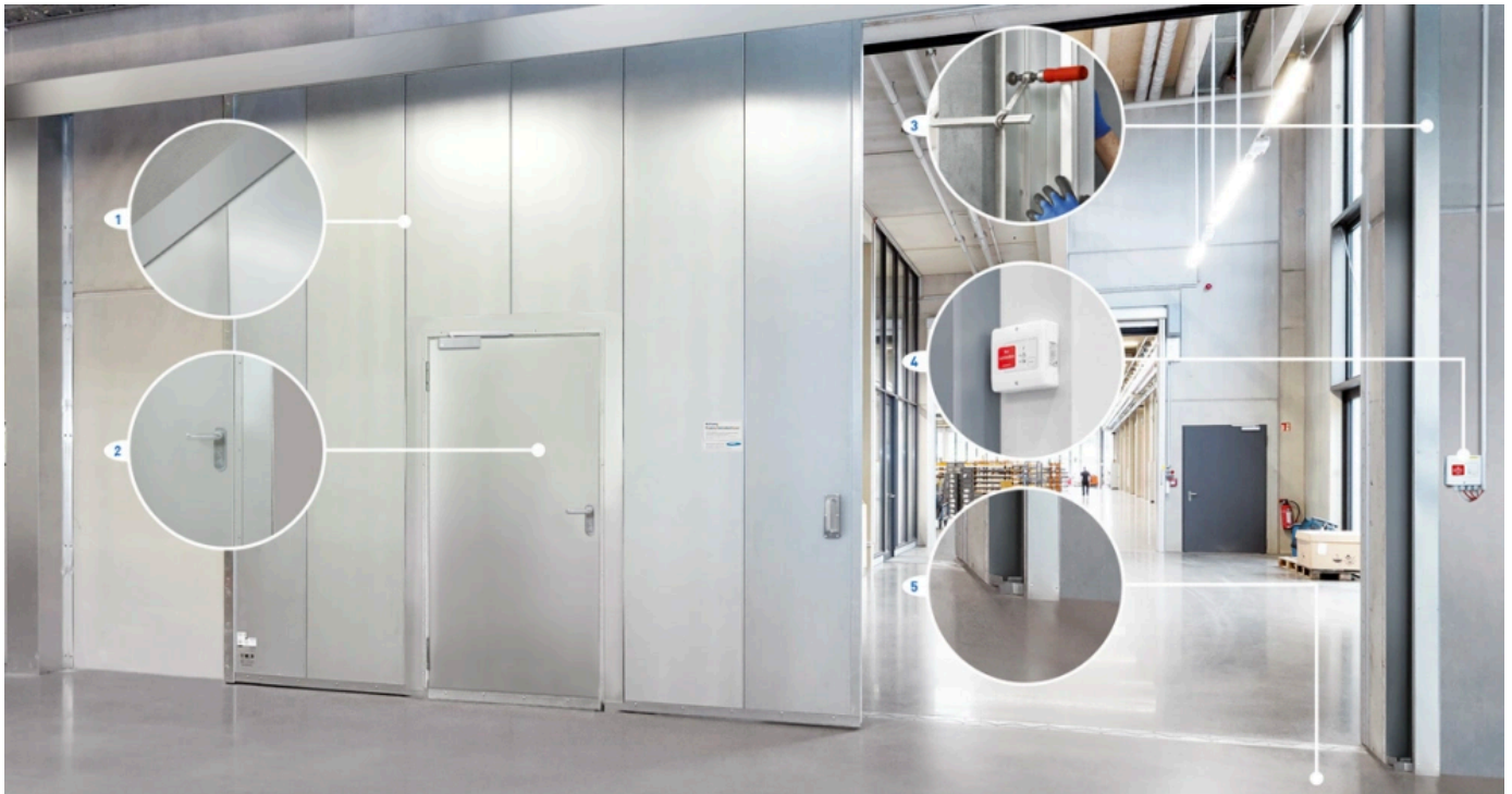
Novoferm Feuerschutz-Schiebetore NovoSlide Industry – Ausführungsdetails