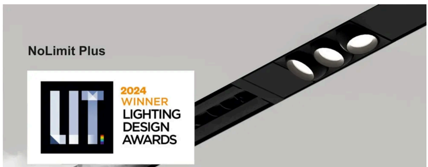
NoLimit Plus – Beleuchtung und Lüftung kombiniert in einer Trockenbau-Decke

NoLimit Plus: Beleuchtung und Lüftung kombiniert in einer Trockenbau-Decke