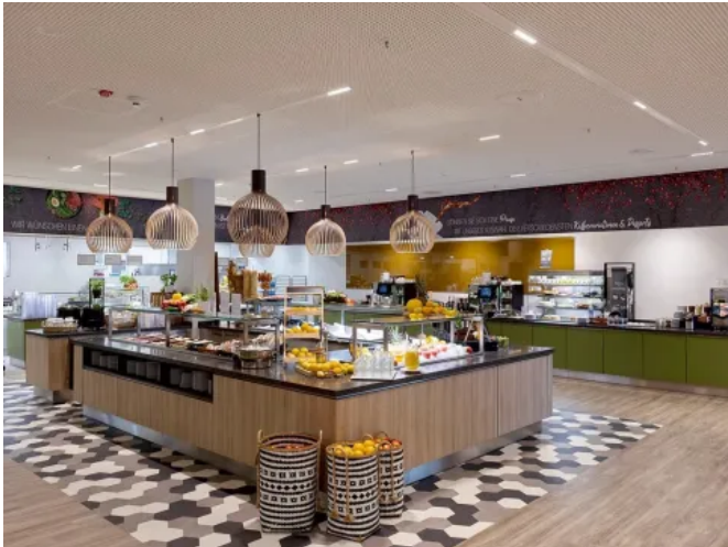
Das Trockenbau-Deckensystem NoLimit Plus lässt sich in Neubauten und Bestandsbauten nahtlos integrieren.

Aus der Serie Trockenbaudecken mit unsichtbarer Systemlösung für technische Deckeneinbauten von NEXFOUR