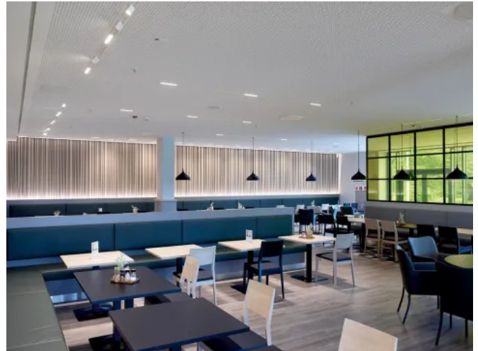
Das Trockenbau-Deckensystem NoLimit Plus eignet sich für Wohnräume über Bürogebäude bis hin zu öffentlichen Einrichtungen.