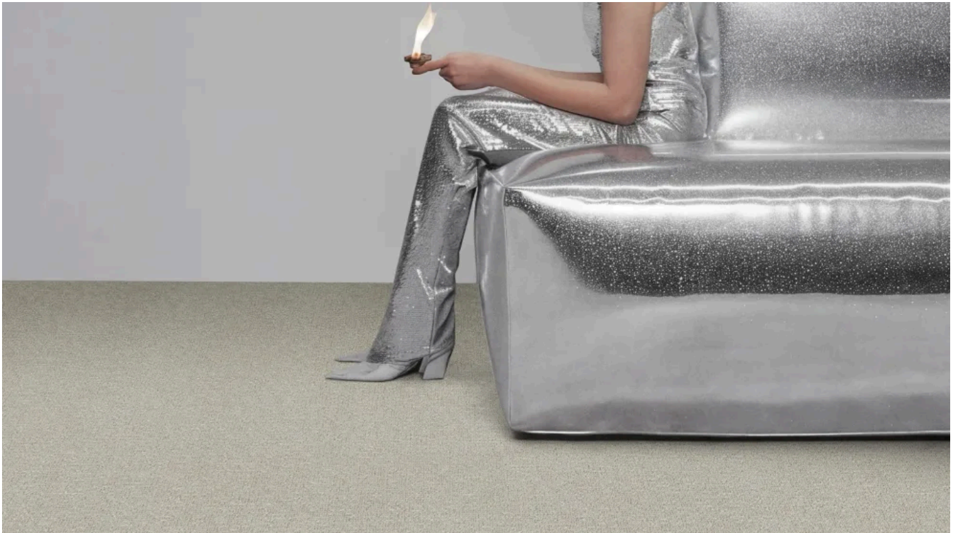
Paradox Duo 800: Fein gesprenkelte Schlingenfliese

Fein gesprenkelte Schlingenfliese mit ruhiger, fast einfarbiger Optik