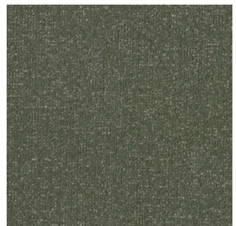
Flux Duoo 800 FOREST