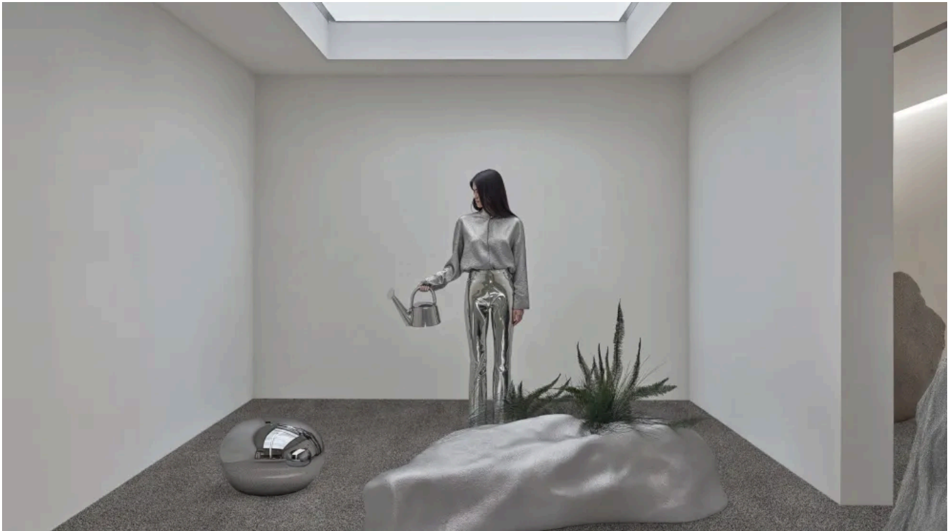
Helix Duoo 1300: Hochfloriger Velours