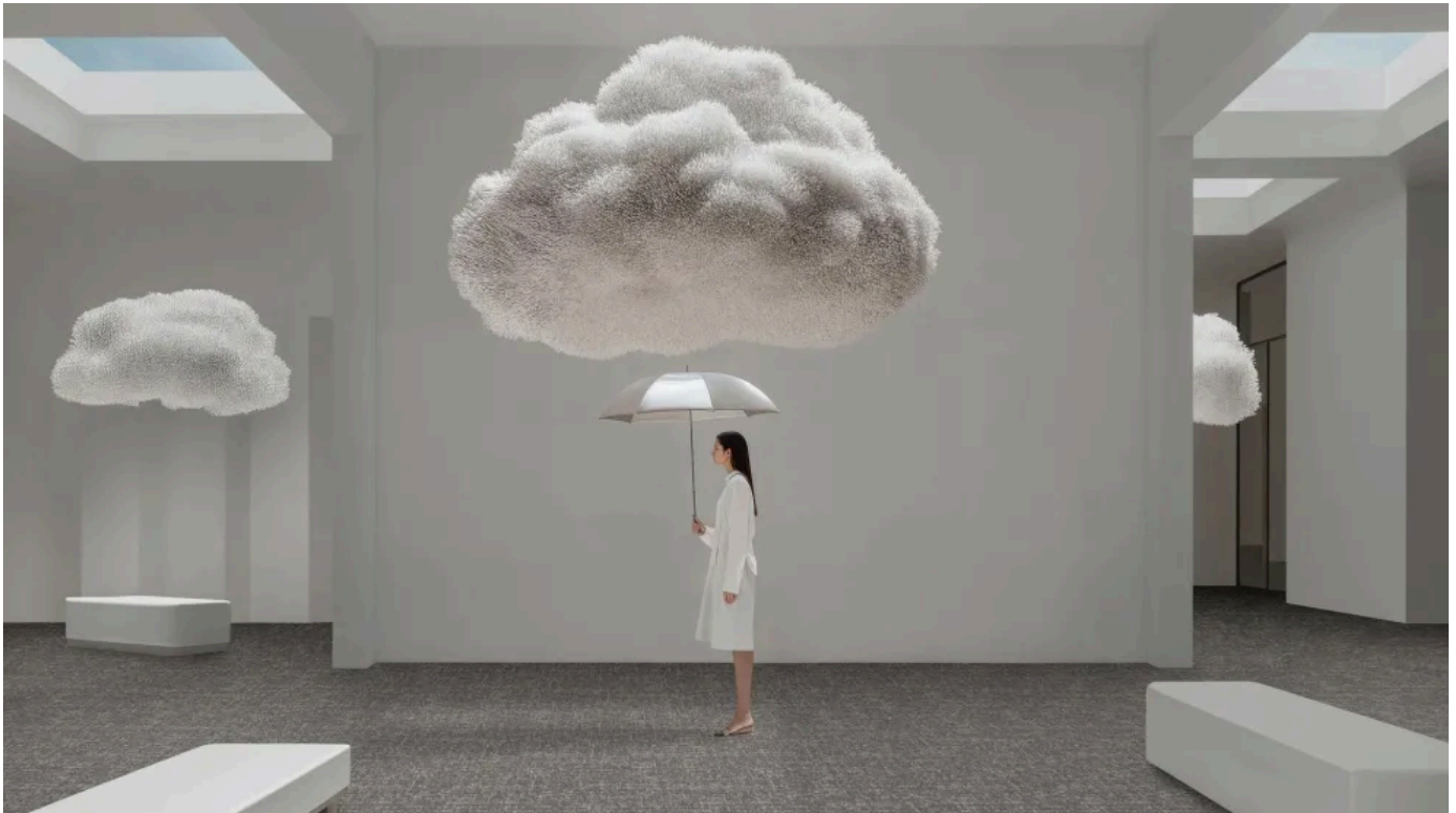
Matrix Duoo 800: Zweifarbige Schlingenfliese mit Hoch-Tief-Struktur

Zweifarbige Schlinge mit Hoch-Tief-Struktur und feinem Raster