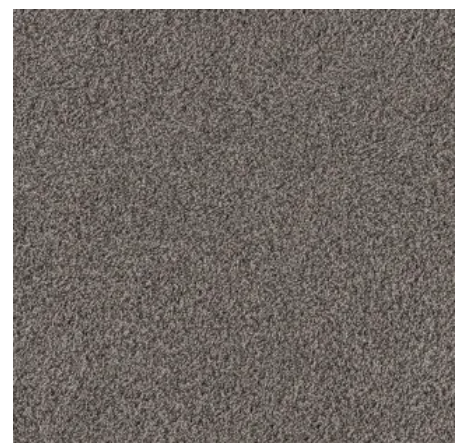
Helix Duoo 1300 GRANIT

Erhältlich als Fliese | Teppichboden | Abgepasster Teppich