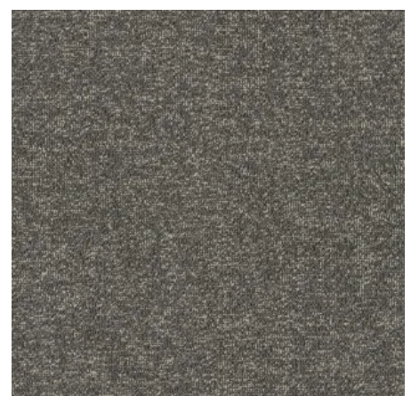
Matrix Duoo 800 ECLIPSE