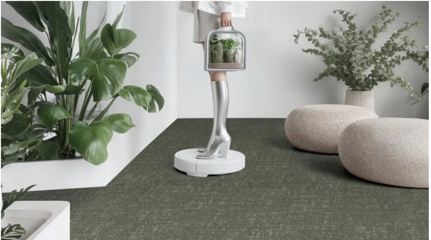
Flux Duoo 800: Organische Schlingenfliese mit feiner Struktur

Organische Schlingenfliese mit feiner Struktur und dezentem Farbspiel