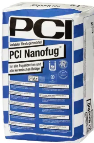
PCI Nanofug® – insbesondere für Steingut- und Steinzeugbeläge

Aus der Serie Fliesenkleber und -Fugenmörtel für alle Keramik- und Naturwerksteinbeläge von Sika Deutschland