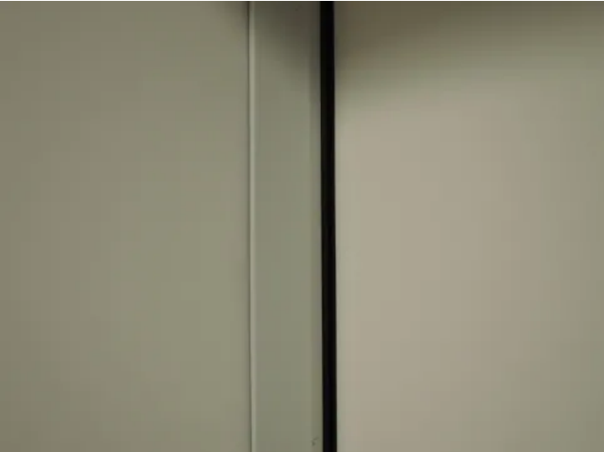
Nachrüst-Rauchschutzsystem "SRS-3", "SD-1" und "SRS-3-Clips" an einer vorhandenen Stahl-Feuerschutztür.