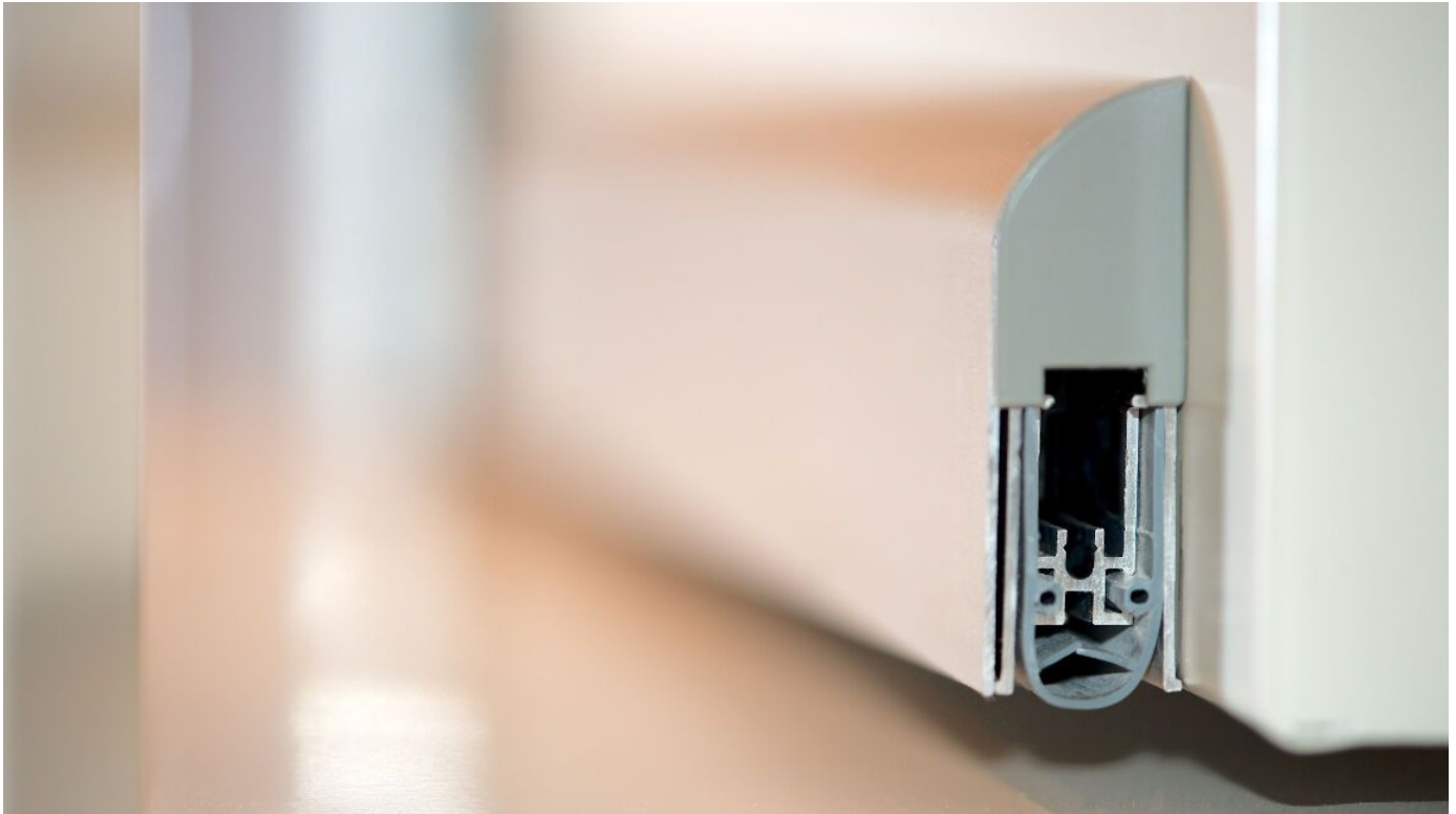
Nachrüst-Rauchschutzsystem für Rauchschutznachrüstung für bestehende ein- und auch zweiflügelige Türen

Aus der Serie Türen und Tore mit Drehflügel von System Schröders Türen + Tore