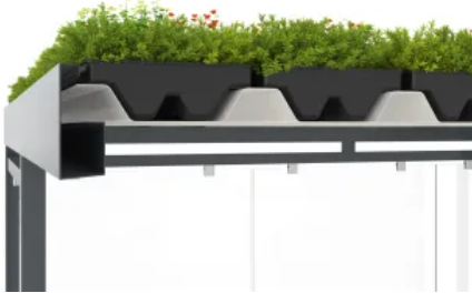
GreenPlus Dachbegrünung für Überdachungssysteme mit Trapezblechprofil-Dacheindeckung

Aus der Serie Stadt- und Freiraumausstattung von WSM - Walter Solbach Metallbau