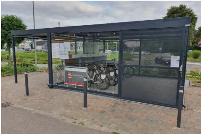
Die überdachte Abstellfläche sorgt für einen geschützten und sicheren Standort für Fahrradparker und E-Bike Leih- und Ladestation.

Aus der Serie Stadt- und Freiraumausstattung von WSM - Walter Solbach Metallbau