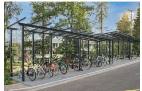
Überdachungssysteme – optional fertig montiert