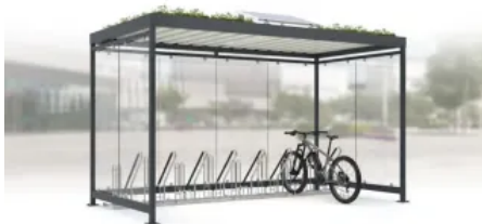
Fahrradüberdachung Köln Dachbegrünung und Solarmodul

Aus der Serie Stadt- und Freiraumausstattung von WSM - Walter Solbach Metallbau