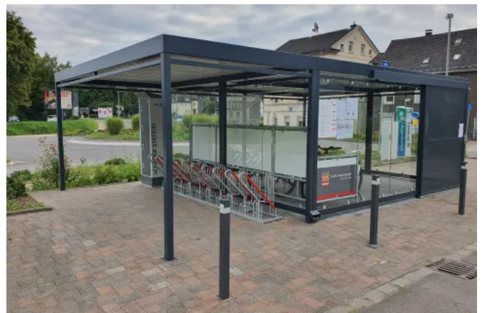
Die Mobilitätsstation Bergneustadt kombiniert Fahrradparken, eBike-Sharing und Ladestationen unter einem Dach.

Die überdachte Abstellfläche für einen geschützten und sicheren Standort für das eBike-Sharing-System. Sowohl Pendler als auch Freizeitnutzer können vor Ort bequem Elektrofahrräder ausleihen und laden.