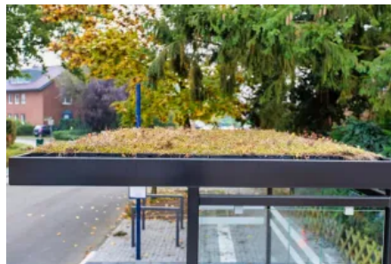
GreenPlus – modulare, nachhaltige Dachbegrünung