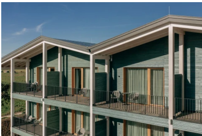
Landhotel Bohrerhof, Hartheim am Rhein - Planung: Rudolf Johannes Lais, Lais Architekten