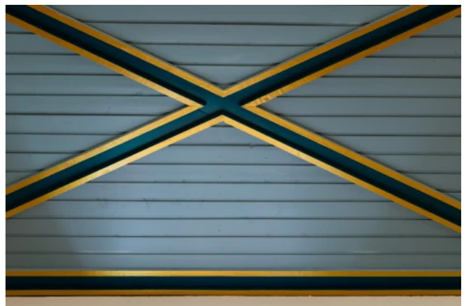
Katholische Kirche St. Walburga, Groß Gera - Planung: Dipl.-Ing. Heinz Raab Ingenieurbüro für Planung und Bauwesen