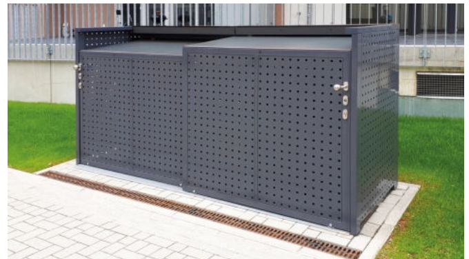
Mülltonnen-Boxen L, Quadratlochblech