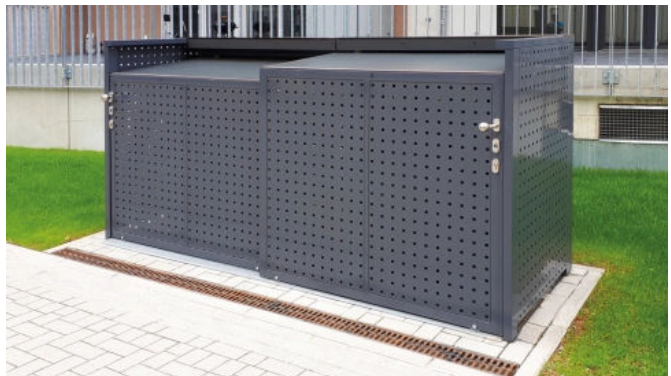
Mülltonnen-Boxen L, Quadratlochblech