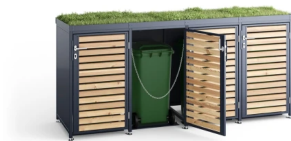
Mülltonnen-Boxen M, Holz, mit Gründach