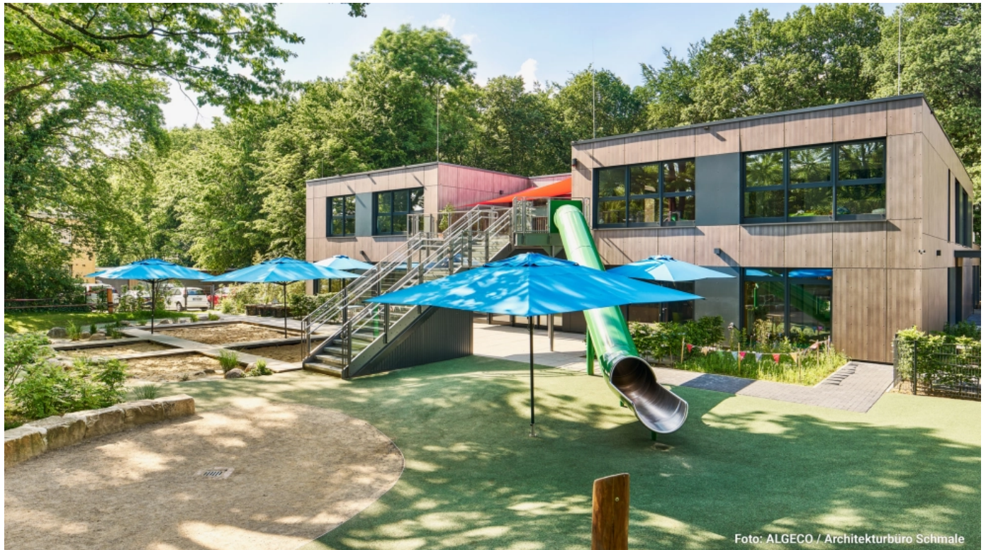
Individuelle Modulbauten mit Charakter; Foto: ALGECO / Architekturbüro Schmale

Frei geplante Modulbauten bieten Bauherren und Architekten jede individuelle Gestaltungsmöglichkeit für anspruchsvolle Raumlösungen mit Charakter.