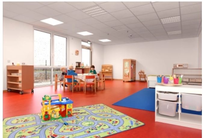
ALGECO Referenzprojekt Kita Vechelde (Smart Kita)

Die Kita in Vechelde bietet auf einer Nutzfläche von mehr als 730 m 2 Platz für 100 Kinder. Nach einer Bauzeit von 18 Wochen wurde der Kindergarten mit vier Gruppenräumen, Küche, Speise-, Schlaf- und Bewegungsraum im Oktober 2017 fristgerecht bezogen. Modulbauspezialist Algeco erstellte das schlüsselfertige Gebäude und kümmerte sich im Rahmen seines 360° Service-Konzeptes auch um die Außenanlagen samt Spielgeräte.