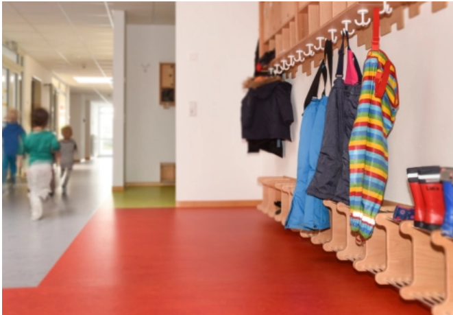
ALGECO Referenzprojekt Kita Vechelde (Smart Kita)