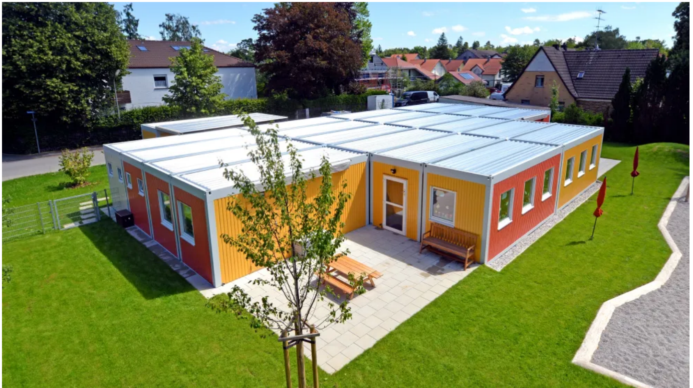
Standard-Modulgebäude: Schnelle Lösung für den langfristigen Bedarf

Mit Standard-Modulbauten von ALGECO entstehen anspruchsvolle mobile Gebäude für den langfristigen Bedarf. Algeco bietet einen umfangreichen Baukasten an hochqualitativen Lösungen zur passgenauen Konfiguration des Gebäudes. So schafft Algeco nachhaltige Wohlfühlräume mit Niveau und der Kunde profitiert gleichzeitig von erprobten, perfekt aufeinander abgestimmten Systemen.