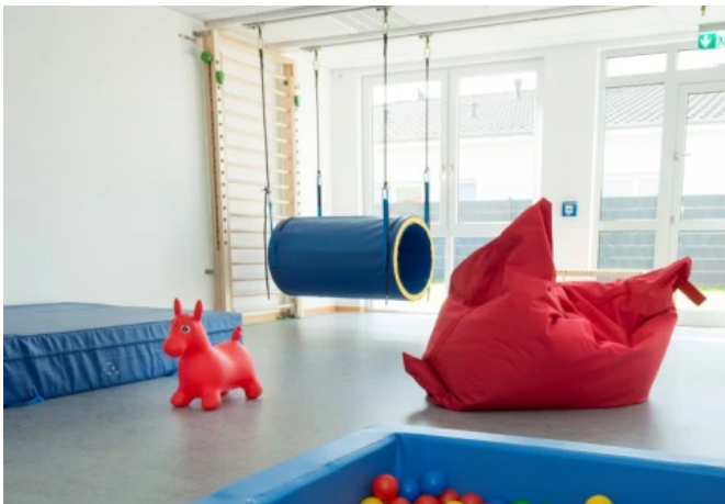
ALGECO Referenzprojekt Kita Vechelde (Smart Kita)