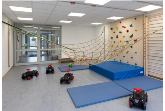
ALGECO Referenzprojekt Kita Vechelde (Smart Kita)