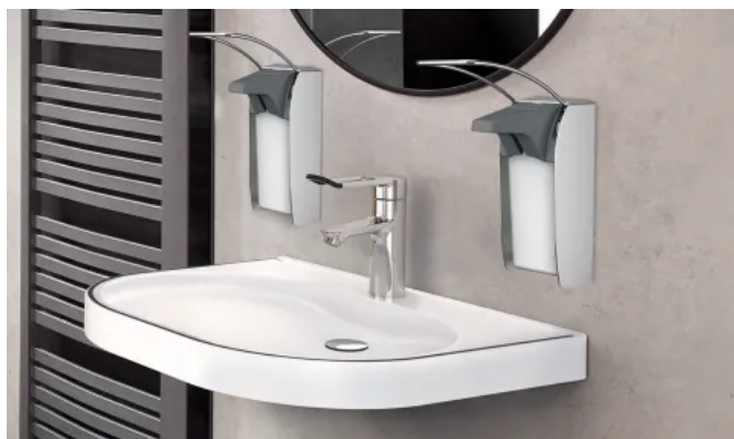
Barrierefreier Waschplatz mit F4LT-Med Thermostat-Einhebelmischer

Die F4LT-Med Thermostat-Einhebelmischer sind für den Einsatz in Krankenhäusern und Pflegeeinrichtungen optimiert und erfüllen alle wichtigen Kriterien für hygienisch sensible Bereiche, wie Sicherheit, Ergonomie und Reinigungsfreundlichkeit. Der verlängerte, ergonomischen Griffhebel erlaubt den Nutzern sicheres Händewaschen. Standardmäßig mit thermostatischem Verbrühungsschutz.