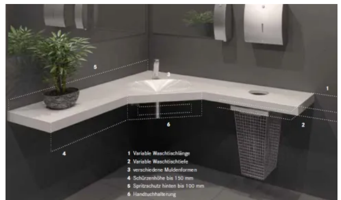
Individuell anpassbare Eck-Waschtischlösung