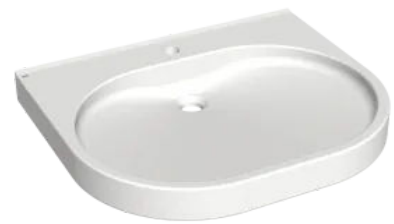
VARIUScare in Alpinweiß