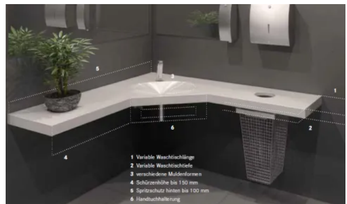
Individuell anpassbare Eck-Waschtischlösung