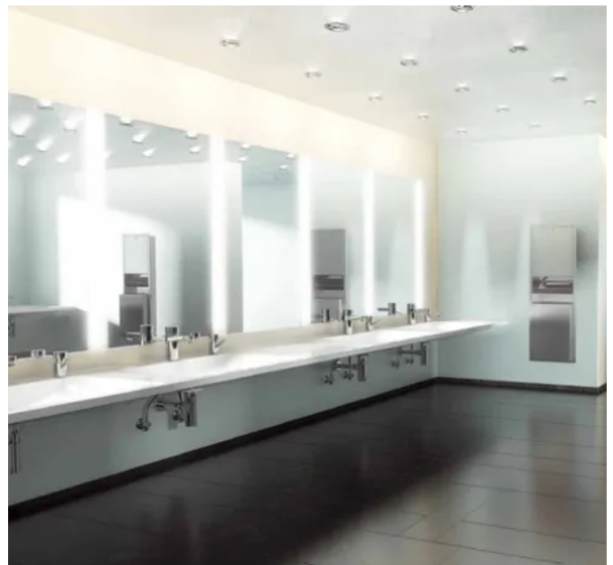
Optimal angepasst: VARIUS bietet die Möglichkeit der individuellen Gestaltung.