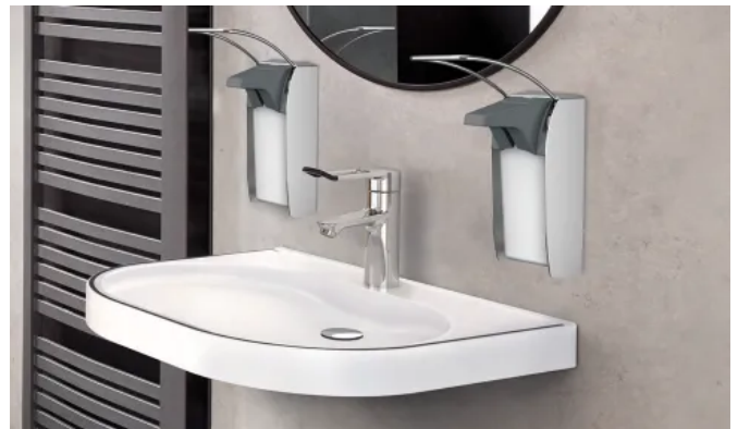
Barrierefreier Waschplatz mit F4LT-Med Thermostat-Einhebelmischer

Die F4LT-Med Thermostat-Einhebelmischer sind für den Einsatz in Krankenhäusern und Pflegeeinrichtungen optimiert und erfüllen alle wichtigen Kriterien für hygienisch sensible Bereiche, wie Sicherheit, Ergonomie und Reinigungsfreundlichkeit. Der verlängerte, ergonomischen Griffhebel erlaubt den Nutzern sicheres Händewaschen. Standardmäßig mit thermostatischem Verbrühungsschutz.