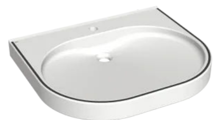
Prämiertes Design: VARIUScare mit Farbstreifen im Waschtischrand

VARIUScare zählt auch zu den Preisträgern des German Design Award 2020 in der Kategorie 'Medical, Rehabilitation and Health Care' . Der Rat für Formgebung - das deutsche Kompetenzzentrum für Design, Marke und Innovation - zeichnete die barrierefreie Waschtisch-Linie unter dem Gesichtspunkt 'Excellent Product Design' in dieser Kategorie aus.