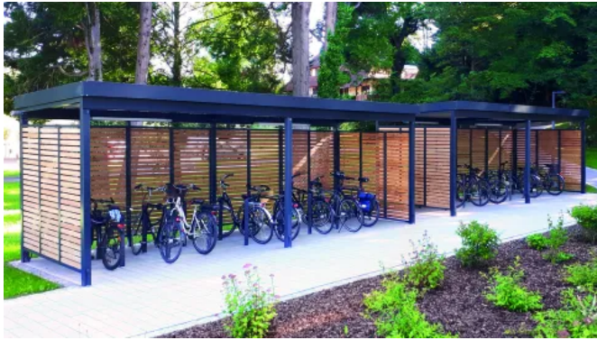
Bikeport in Füllungsvariante Lärchenholz

Aus der Serie Überdachungen von Gerhardt Braun