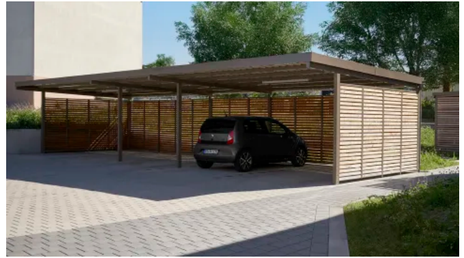
Carport in Füllungsvariante Lärchenholz