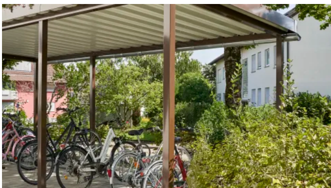
Bikeport ohne Füllung