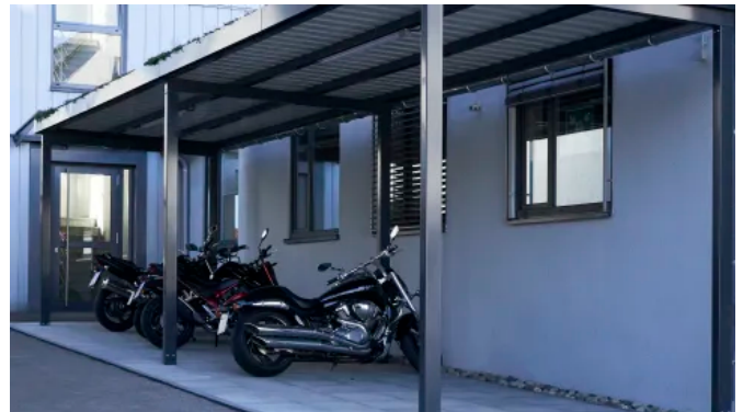
Bikeport ohne Füllung