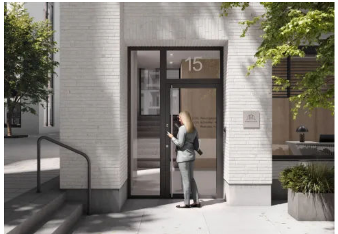
blueMotion+ von Winkhaus: Die vollmotorische Mehrfachverriegelung für exklusive Eingangstüren.

Das integrierte Bluetooth-/WLAN-Modul ermöglicht auch hier die Steuerung über die doorControl App, während zusätzliche Features wie die Tag/Nacht-Funktion oder Holiday-Lockout-Funktion maximale Sicherheit und Flexibilität bieten.