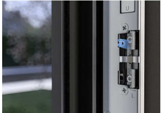
Durch die innovative Tagesfalle „TaFa“ von Winkhaus ist das Einstellen der Tür in eine Durchgangsfunktion mit nur einem Klick möglich.