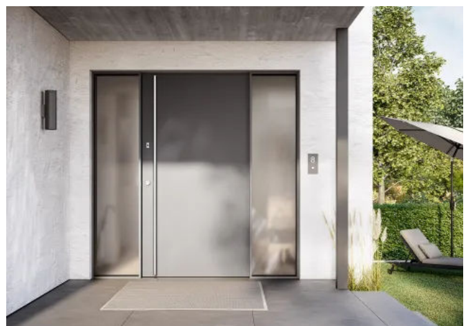
Automatisch zu. Motorisch auf. Noch komfortabler öffnen und schließen mit Winkhaus blueMatic EAV4.

Für noch mehr Flexibilität sorgt die optionale Tagesfalle (TaFa), die ein zeitweises Offenhalten der Tür ermöglicht. Damit eignet sich die blueMatic EAV4 optimal für Privathäuser und gewerbliche Objekte mit wechselnden Nutzern.