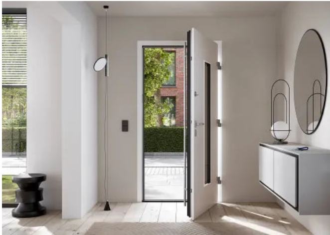
Sicherheit, Dichtschluss, Komfort – autoLock AV4D vereint alles.

Aus der Serie Moderne Türverriegelungen für anspruchsvolle Sicherheitsansprüche von Aug. Winkhaus