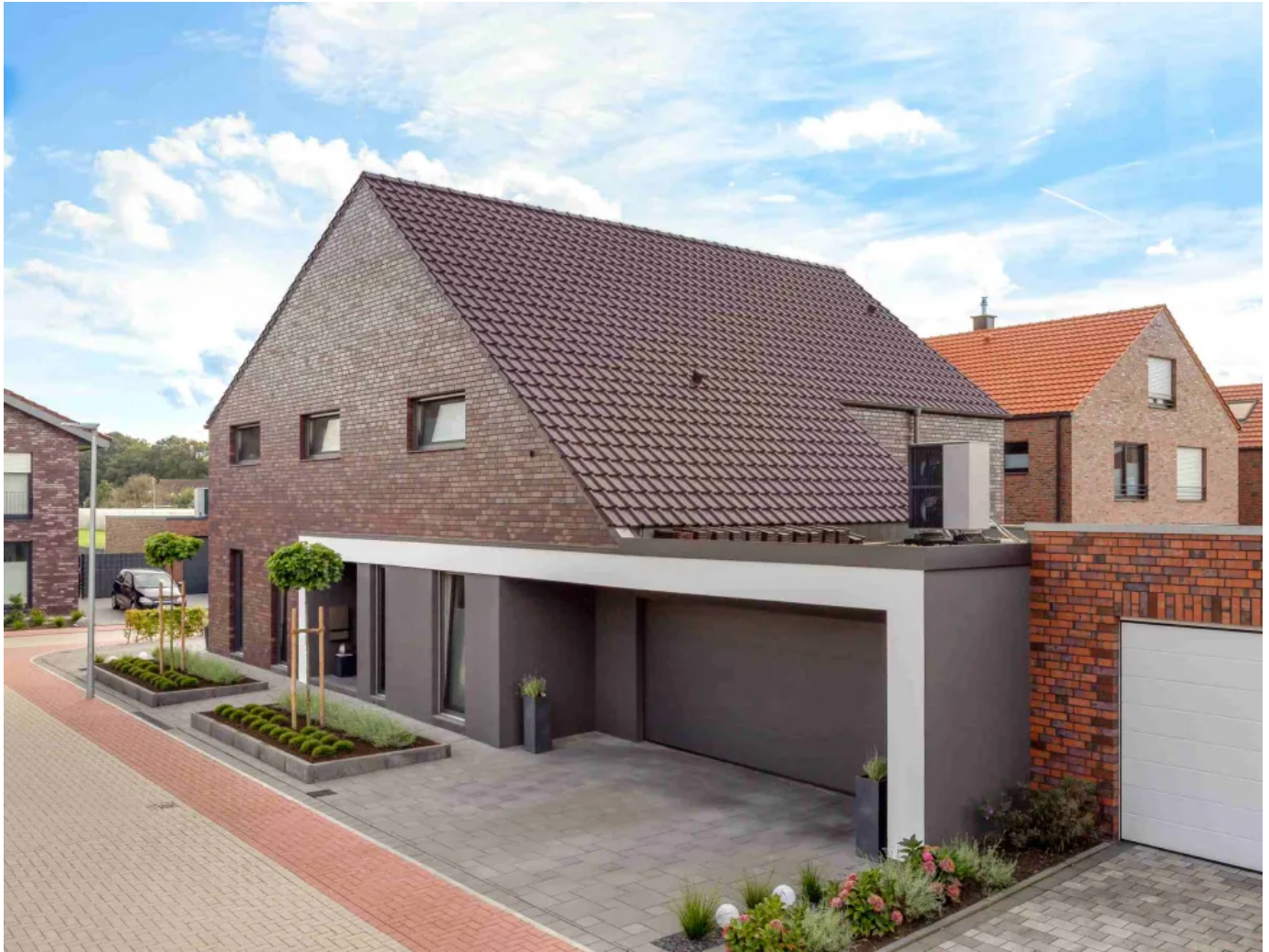
Ein Einfamilienhaus in Klinkerbauweise mit dem farblich dazu passenden Flachdachziegel J11v in bordeauxrot matt

Aus der Serie Moderne Tondachziegel von Jacobi Dachziegel