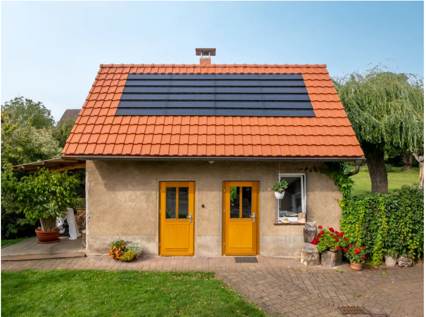
Dacheindeckung mit J160-PV Indach-Modulen, edelschwarz

Aus der Serie Moderne Tondachziegel von Jacobi Dachziegel