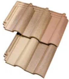
Sonderserie Bella Casa

Aus der Serie Moderne Tondachziegel von Jacobi Dachziegel