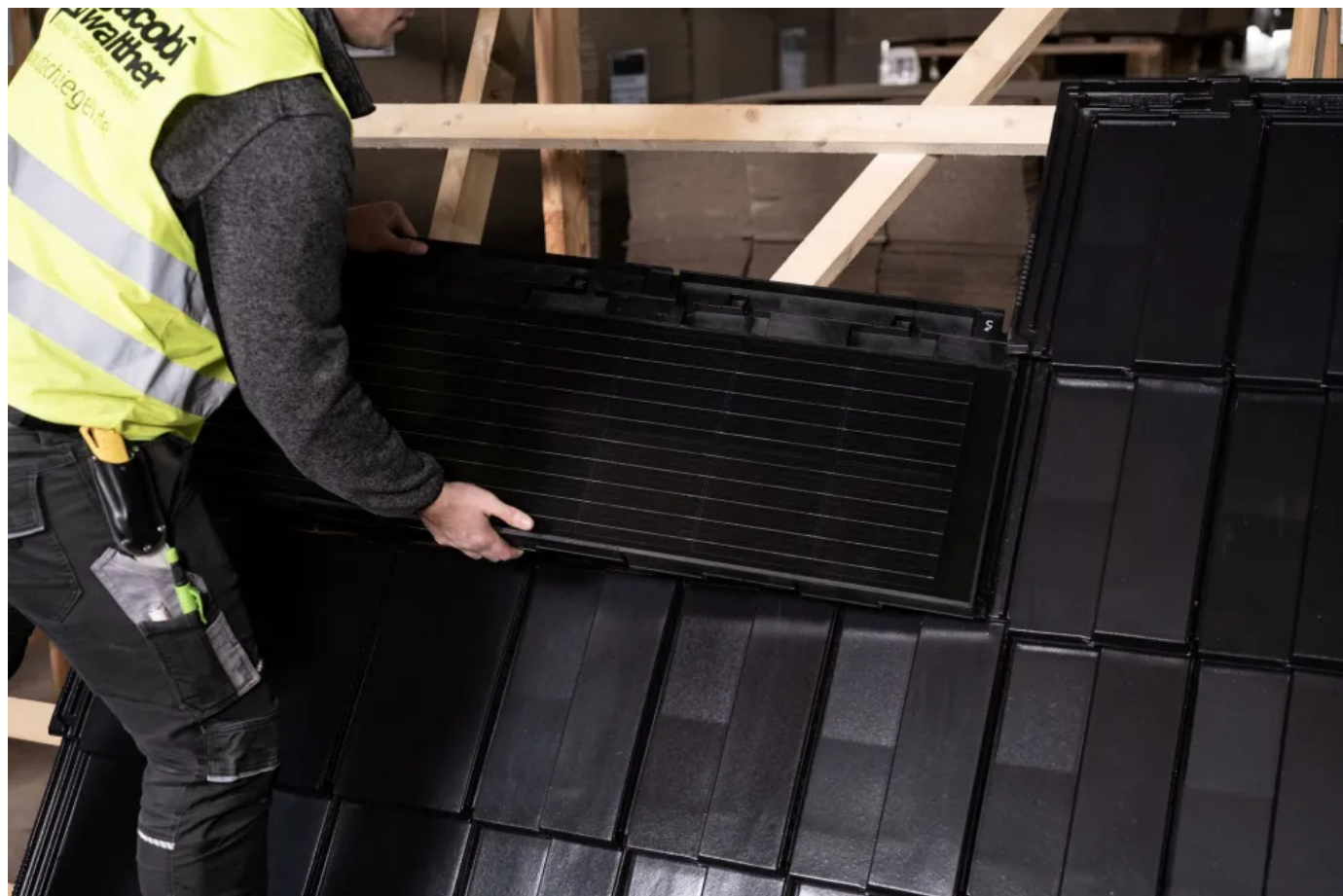
Verlegung der J160-PV Indach-Module

Aus der Serie Moderne Tondachziegel von Jacobi Dachziegel