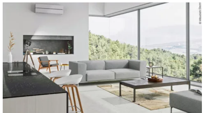
Diamond Wandgerät MSZ-LN, Farbtone Pearl White