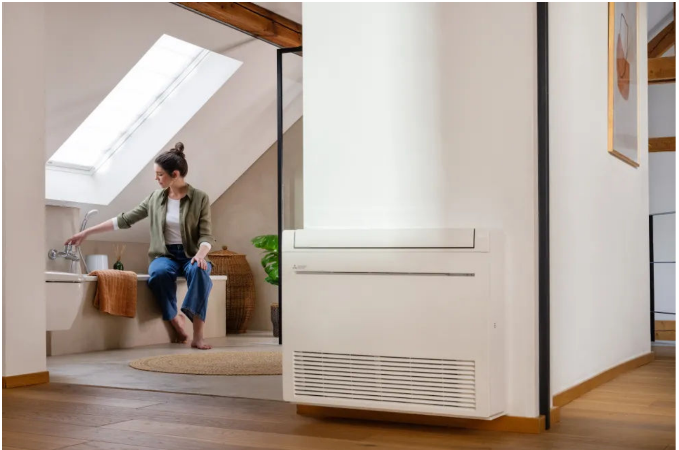
Kompakt Truhengeräte MFZ KT