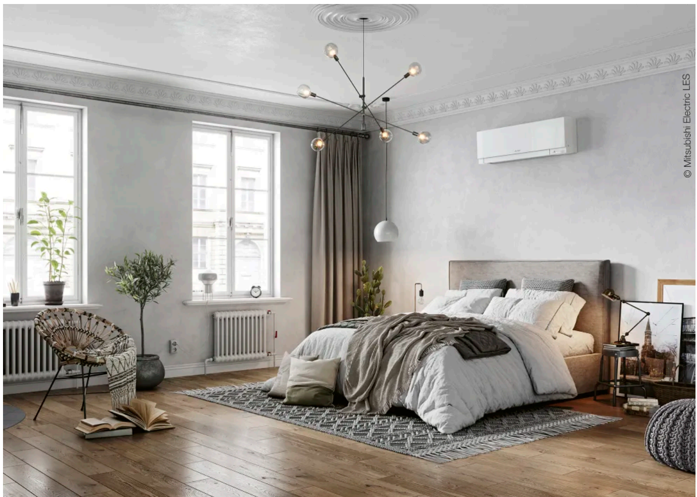
Premium-Design-Wandgeräte MSZ-EF