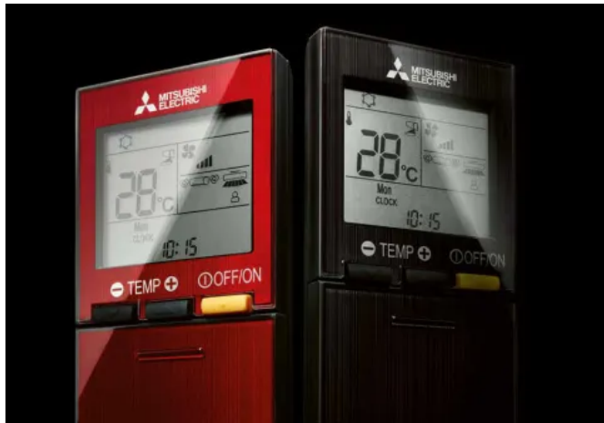
Diamond Wandgerät MSZ-LN, Fernbedienungen

Aus der Serie Klimageräte und Lüftungsgeräte von Mitsubishi Electric Europe B.V.