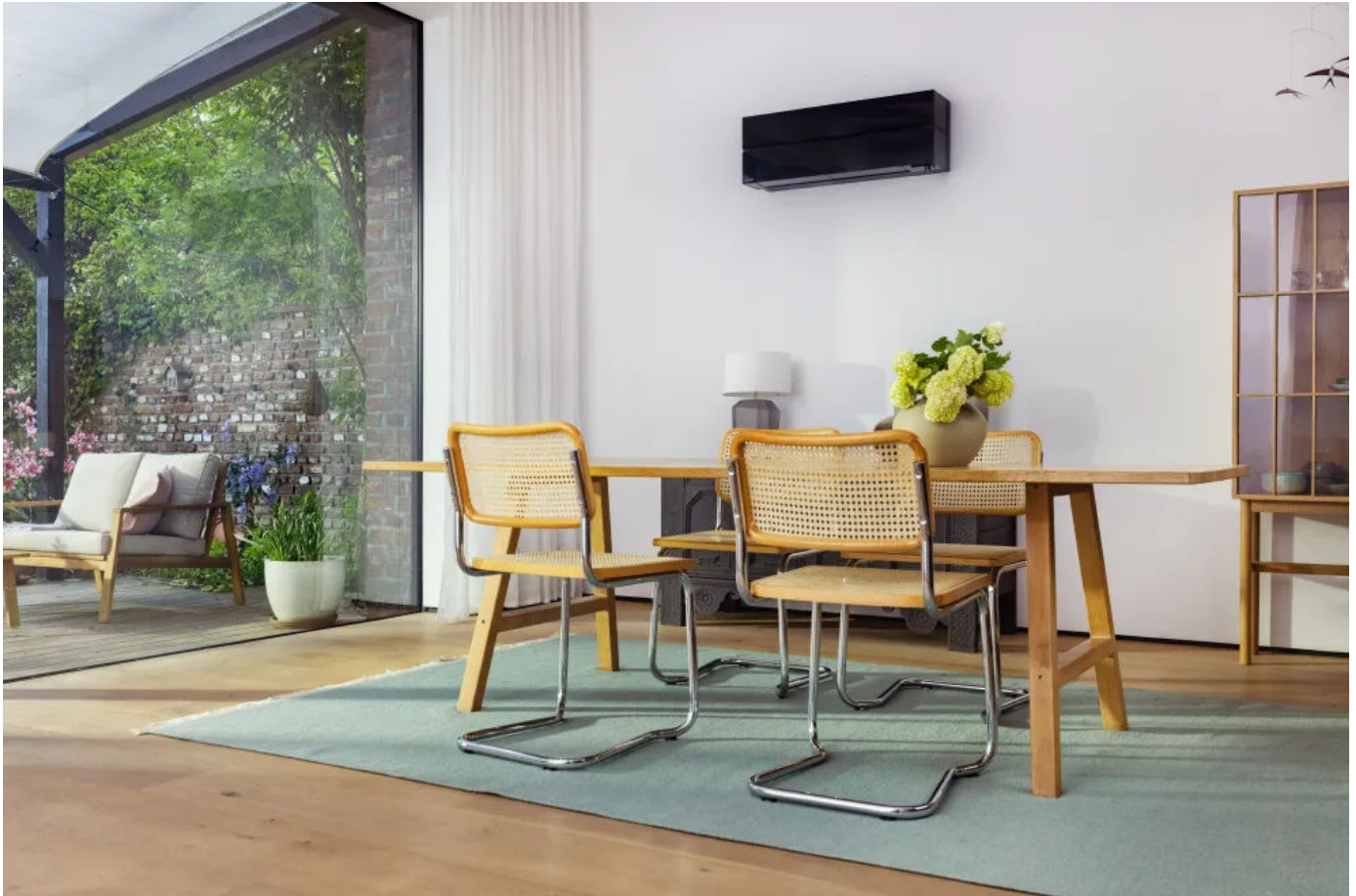
Diamond Wandgerät MSZ-LN, Farbtone Onyx Black