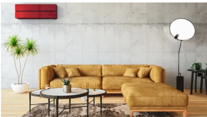
Diamond Wandgerät MSZ-LN, Farbtone Ruby Red

Wandgerät in besonders hochwertigem Design mit lackierter Oberfläche, erhältlich in 4 Farbvarianten mit passenden Fernbedienungen