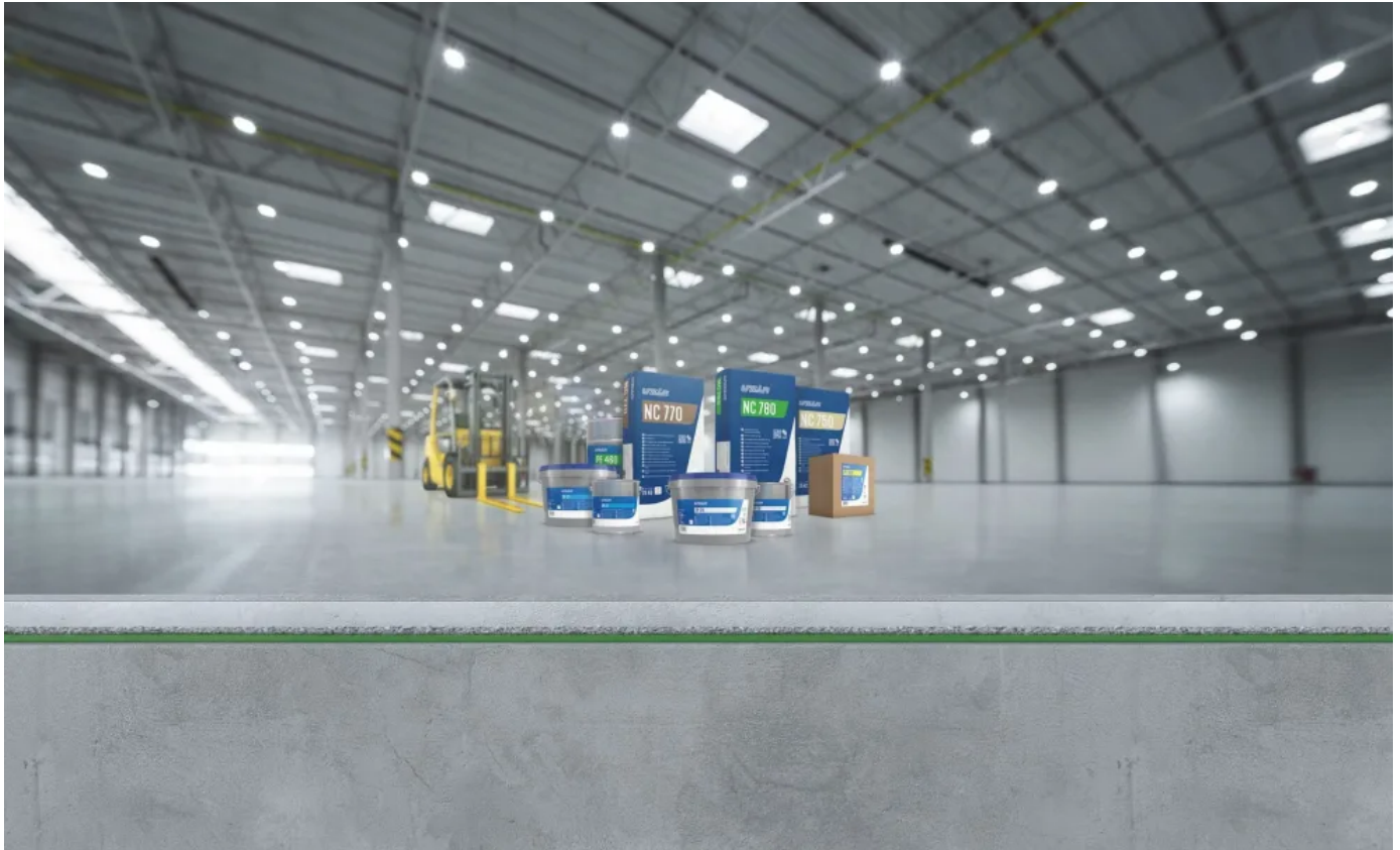
UZIN Oberflächensystem für Industrie, Gewerbe, Retail aus Grundierung, mineralischer Beschichtung und abschließender Versiegelung.

Aus der Serie Bodenbeschichtungen im Design- und Industriebereich von Uzin Utz