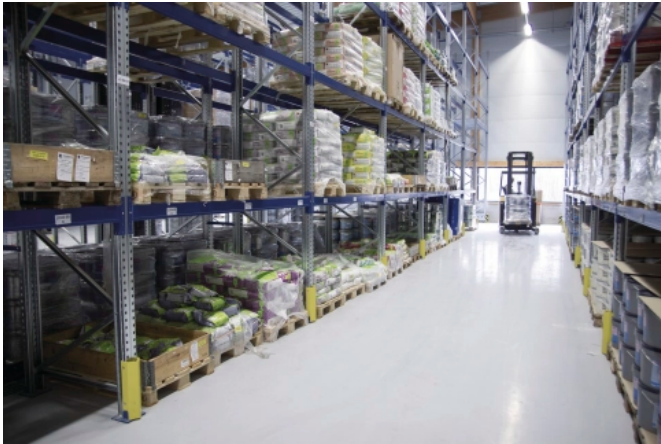
Für Böden von Gewerbeflächen, die stärker belastet sind, realisiert die zementäre Industrie-Topcoatspachtelmasse UZIN NC 770 eine verschleißfeste Oberfläche ohne optische Ansprüche.

Aus der Serie Bodenbeschichtungen im Design- und Industriebereich von Uzin Utz