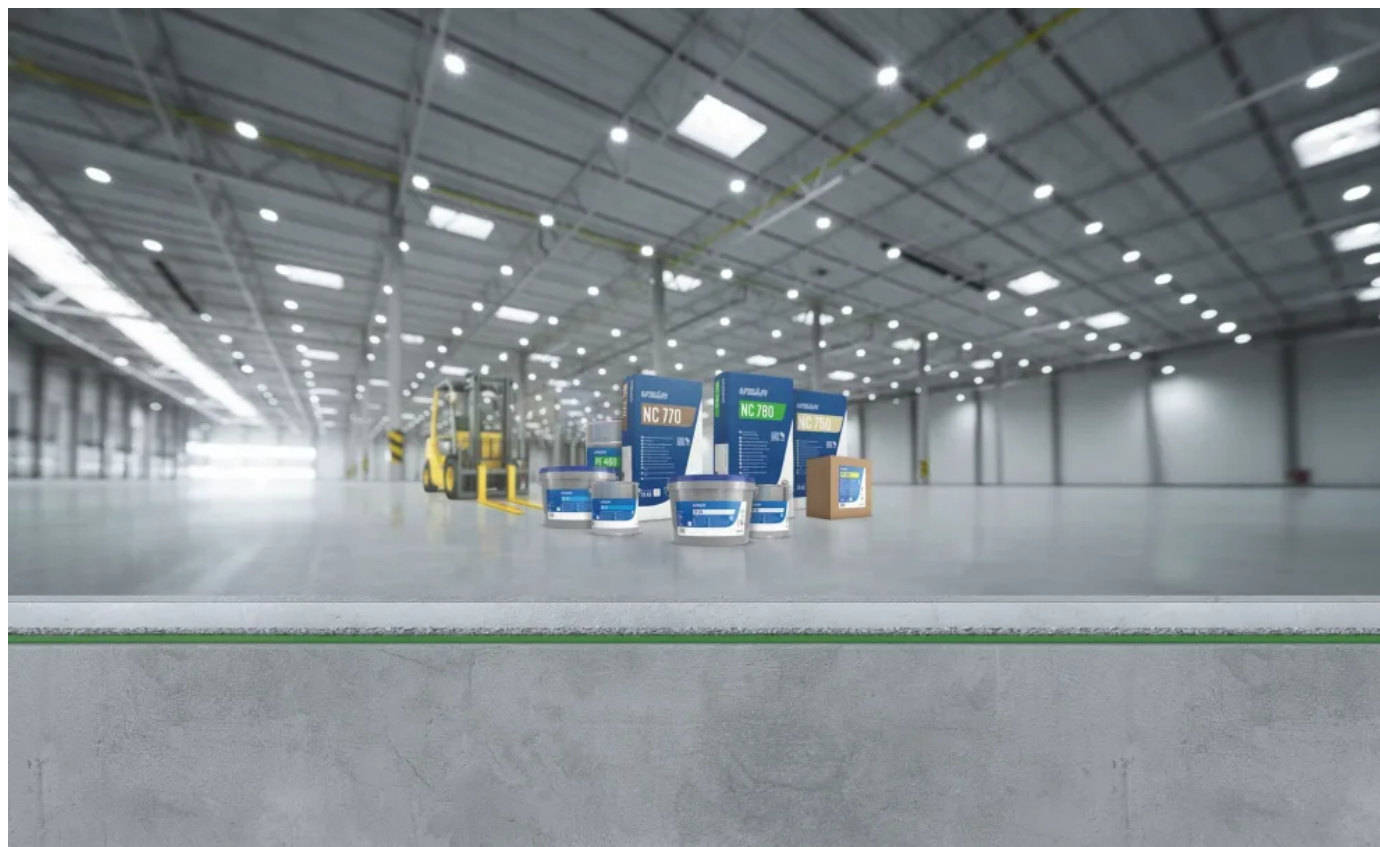
UZIN Oberflächensystem für Industrie, Gewerbe, Retail aus Grundierung, mineralischer Beschichtung und abschließender Versiegelung.

Aus der Serie Bodenbeschichtungen im Design- und Industriebereich von Uzin Utz