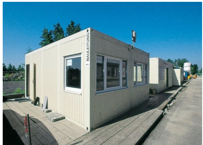
ORIGIN - Bauleitungscontainer

Der WERKSTATTCONTAINER der ORIGIN-Reihe ist als Duo- oder Trio-Anlage verfügbar. Mit seiner speziellen Ausstattung trotzt er härtesten Herausforderungen und Belastungen: breite zweiflügelige Tür, Bodenbelag aus Metallplatten, Metallverkleidung an den Wänden und eine auf den Maschineneinsatz ausgelegte Elektroinstallation.