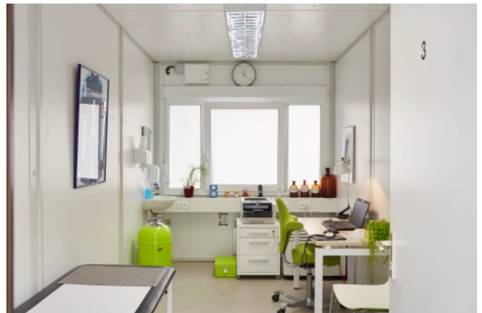
ADVANCE IN: das vielseitige, flexible Economy-Mietsystem