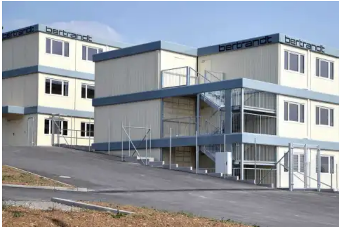
ADVANCE IN: das vielseitige, flexible Economy-Mietsystem

Aus der Serie Modulare Raumlösungen von ALGECO