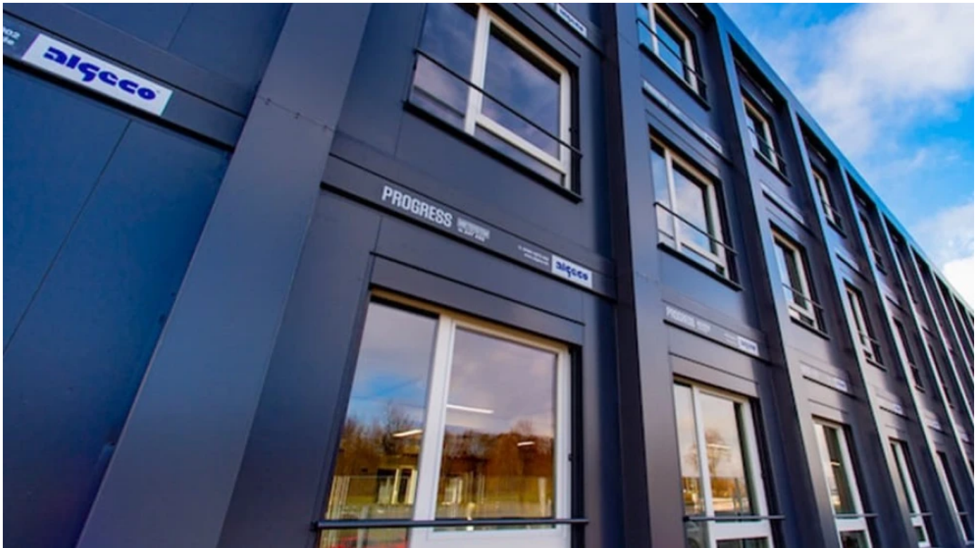
PROGRESS: Hochwertige Premium-Mietlösung für den langfristigen Einsatz

Bei PROGRESS ist der Name Programm: ALGECO lebt Fortschritt und steht für eine neue Dimension im Mietbereich. Bauherren und Architekten können wie bei einem konventionellen Bau ihre individuellen Wünsche verwirklichen und sich zugleich maximale Flexibilität bei der Gebäudenutzung erhalten.