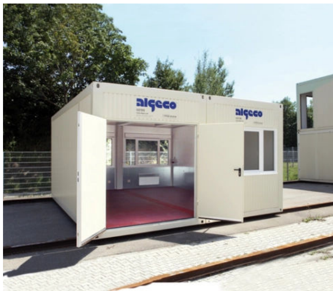
ORIGIN - Werkstattcontainer außen