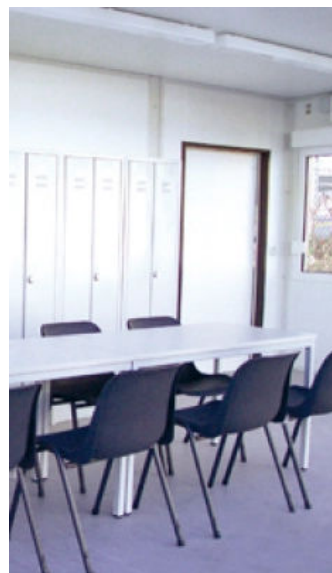
ORIGIN - Besprechungsraum

Der „ORIGIN“ Werkstattcontainer ist als Duo- oder Trio-Anlage verfügbar. Die breite 2-flügelige Tür, der Bodenbelag aus Metallplatten, die Metallverkleidung an den Wänden und die entsprechend ausgelegte Elektro-Installation machen dieses Spezialprodukt zur optimalen Raumlösung für Werkstattbetrieb und Maschinen.