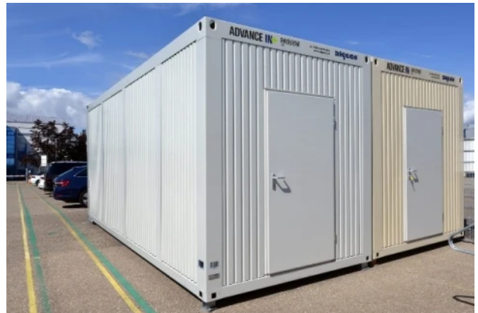
ADVANCE IN PLUS