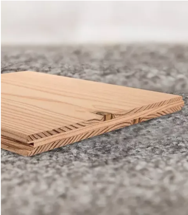
Aufbau einer Dreischichtdielen

Aus der Serie Massivholz- und Mehrschicht-Dielenböden von DIPRO - DIELEN & PARKETT