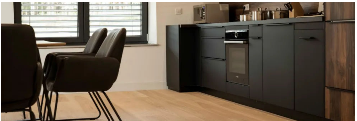
Studio in Esslingen mit Mehrschichtdielen