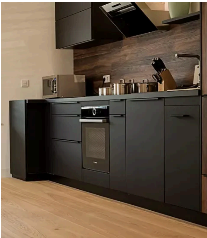
Studio in Esslingen mit Mehrschichtdielen