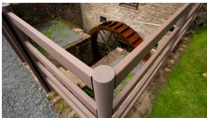
Zaunfeld ASCANIA mit runden Pfosten und rechteckigen Riegeln in Lavabraun, Kupfersieffermühle in Rösrath