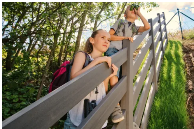
Zaunfeld ASCANIA mit quadratischen Pfosten und rechteckigen Riegeln in Schiefergrau

Aus der Serie megawood® Sichtschutz und Zäune von megawood by Novo-Tech