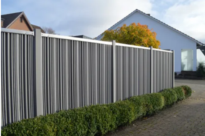
Zaunelement AUGUSTA mit Edelstahlriegel und gewellten Paneelen in Sel Gris

Aus der Serie megawood® Sichtschutz und Zäune von megawood by Novo-Tech