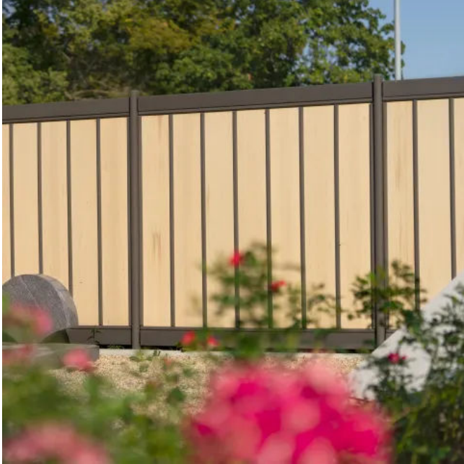
Zaunelement COLONIA mit Paneelen in Ingwer, Riegel und Pfosten in Lavabraun, Friedhof Aschersleben

Aus der Serie megawood® Sichtschutz und Zäune von megawood by Novo-Tech