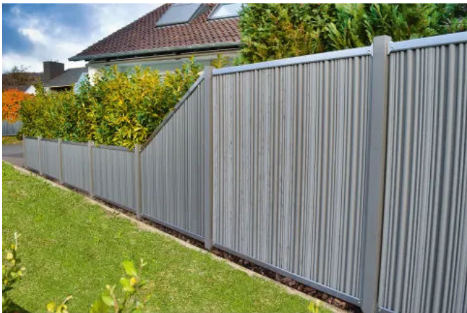
Zaunelement AUGUSTA mit Edelstahlriegel und gewellten Paneelen in Sel Gris