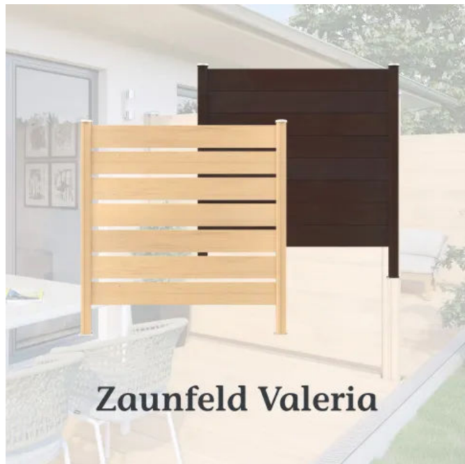
Zaunfeld VALERIA mit und ohne Zwischenräume, Paneele und Pfosten in Ingwer bzw. Varia Schokoschwarz