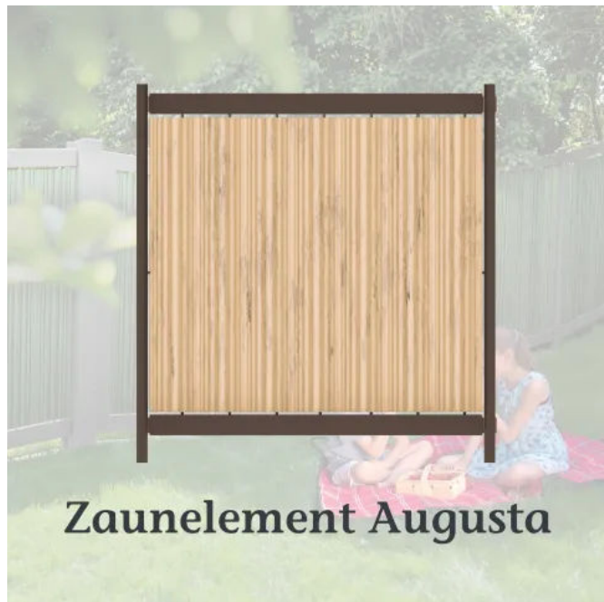
Zaunelement AUGUSTA, gewellte Paneele in Ingwer, Riegel und Pfosten in Lavabraun