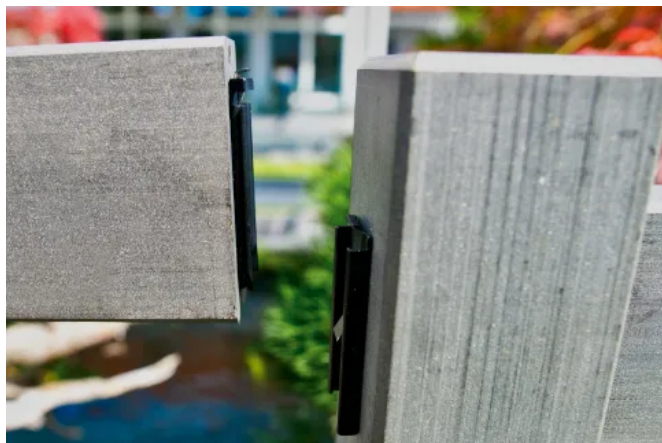
Zaunfeld ASCANIA mit quadratischen Pfosten und rechteckigen Riegeln in Schiefergrau, Riegelverbinder für einfaches Einrasten der Riegel