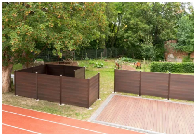
Zaunfeld VALERIA ohne Zwischenräume, Paneele und Pfosten in Varia Schokoschwarz, Burgschule Aschersleben