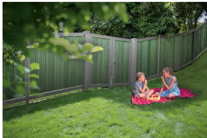
Zaunelement AUGUSTA, gewellte Paneele in Lorbeer, Riegel und Pfosten in Schiefergrau, geländefolgender Aufbau