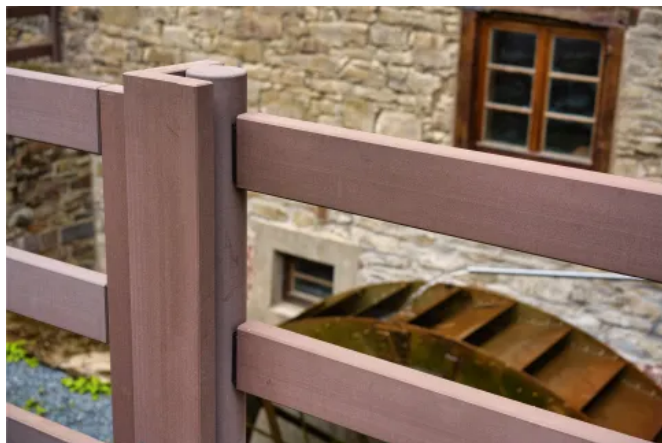
Zaunfeld ASCANIA mit runden Pfosten und rechteckigen Riegeln in Lavabraun, Kupfersiefermühle in Rösrath