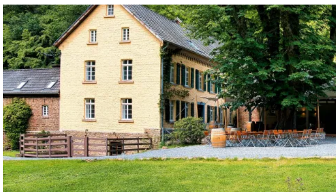
Zaunfeld ASCANIA mit runden Pfosten und rechteckigen Riegeln in Lavabraun, Kupfersieffermühle in Rösrath