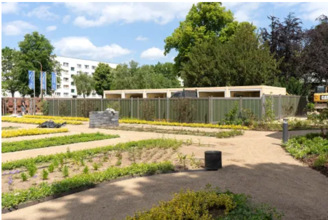
Zaunelement COLONIA mit Paneelen in Lorbeer, Riegel und Pfosten in Schiefergrau, Friedhof Aschersleben