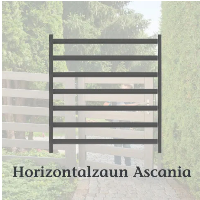
Horizontalzaun ASCANIA mit Riegel und Pfosten in Schiefergrau