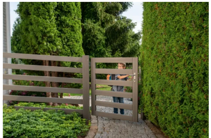
Zaunfeld ASCANIA mit Pfosten und rechteckigen Riegeln in Schiefergrau