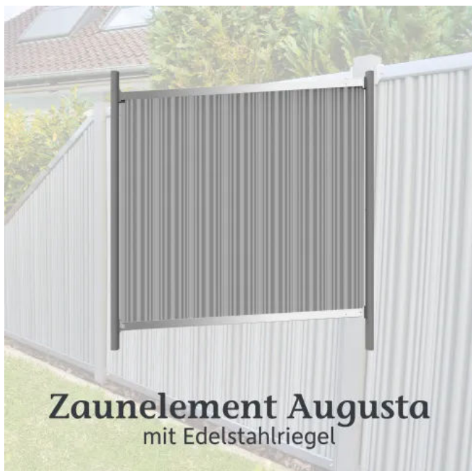
Zaunelement AUGUSTA mit Edelstahlriegel und gewellten Paneelen in Sel Gris