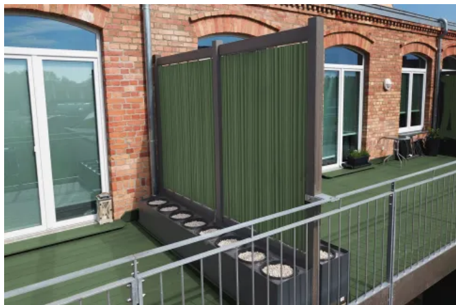
Zaunelemente ASCANIA mit gewellten Paneelen in Lorbeer, Riegel und Pfosten in Schiefergrau als Sichtschutz, Mehrfamilienhaus in Aschersleben

Aus der Serie megawood® Sichtschutz und Zäune von megawood by Novo-Tech