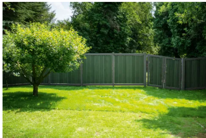
Zaunelement AUGUSTA, gewellte Paneele in Lorbeer, Riegel und Pfosten in Schiefergrau, geländefolgender Aufbau