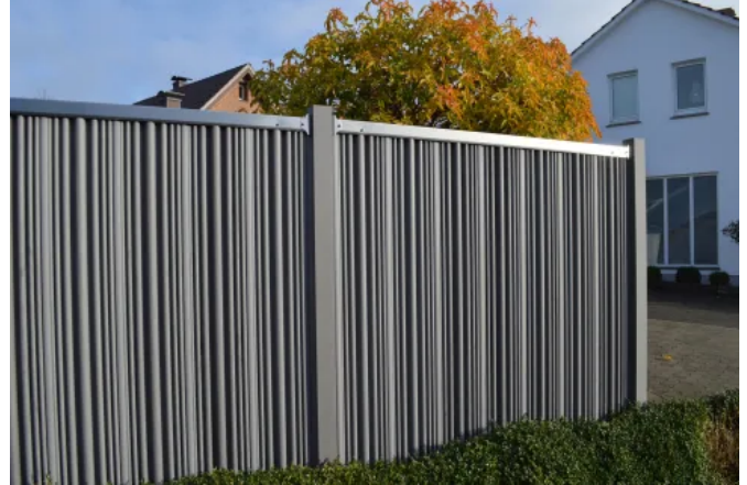
Zaunelement AUGUSTA mit Edelstahlriegel und gewellten Paneelen in Sel Gris