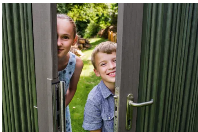
Tür/Tor mit AUGUSTA Paneelen in Lorbeer, Torrahmen/Zarge in Schiefergrau, Beschläge und Einsteckschloss