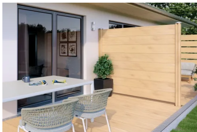
Zaunfeld VALERIA mit und ohne Zwischenräume, Paneele und Pfosten in Ingwer