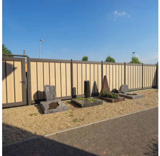
Zaunelement COLONIA mit Paneelen in Ingwer, Riegel und Pfosten in Lavabraun, Friedhof Aschersleben